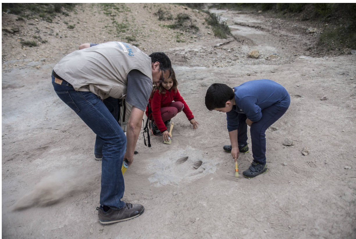
Auf den Spuren der Dinosaurier

Wer sich für Geologie interessiert, findet in Katalonien eine Landschaft mit mannigfaltigen Möglichkeiten zu forschen, zu erleben und zu erfahren. Von den surreal anmutenden Felsformationen des Cap de Creus über die nadelspitzen Steintürme des Montserrat bis zu den paläontologischen Fundstellen der Conca Dellà reicht die Spannweite unterschiedlicher Landschaften. Besonders dicht und leicht zu erschließen sind Kataloniens geologische Besonderheiten allerdings vor allem in zwei großen Gebieten, dem Geopark Orígens und dem Geopark Zentralkatalonien . Beide hüten Höhlen und Grotten, Minen, Hohlwege und spektakuläre Felswände, die jede Exkursion zum unvergesslichen Erlebnis machen.