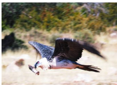
Bartgeier