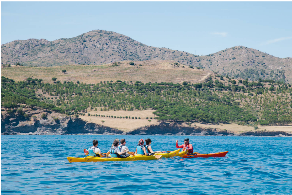
Ecokayaking am Cap de Creus