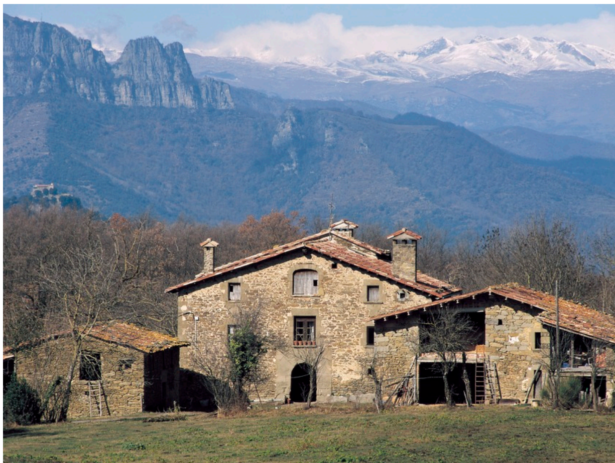
La Vall d'en Bas – Ein zauberhaftes Wanderland voller Geschichten

Überdies hüten diese Landschaften eine ganze Menge alter Legenden und zauberhafter Geschichten. Diesen kommt man am besten mit der App Bas de Màgia auf die Spur. Die Atmosphäre des Tales und seine besondere Kultur kann man aber auch in den örtlichen Bauernhöfen, Ateliers und Werkstätten kennenlernen. Viele von Ihnen öffnen ihre Tore für Besucher und bieten Erlebnisprogramme oder Workshops für Familien an. Nicht zuletzt ist die Küche von La Vall d'en Bas und Les Preses eine besonders genussvolle Möglichkeit, das Tal und seine Besucher kennenzulernen. Wir stellen Ihnen unsere Top 5 in La Vall d'en Bas und Les Preses vor.