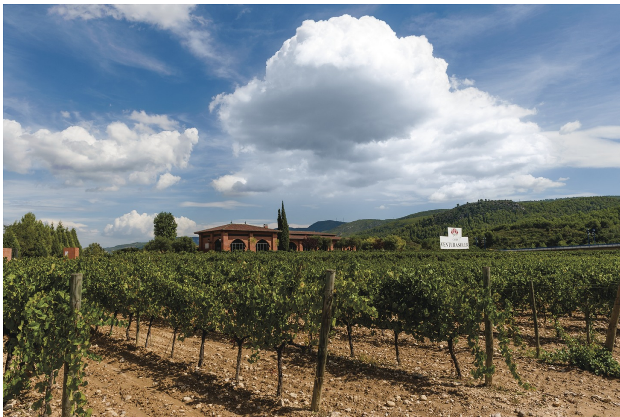
Caves Ventura Soler

aromatische Weißweine, fruchtige Rosés, intensive, aber relativ leichte Rotweine sowie Perlweine gekeltert werden. Inmitten der lieblichen Hügellandschaft stechen die Weinorte Vilafranca del Penedès und Sant Sadurní d'Anoia hervor, wo nicht nur einige der renommiertesten Kellereien Spaniens ihren Sitz haben. In Vilafranca ist in einem mittelalterlichen Schloss aus dem 13. Jahrhundert auch ein Museum für katalanische Weinkultur untergekommen, das mit Ausstellungen, Vorträgen und Weinproben die Geschichte des Weins aufbereitet.