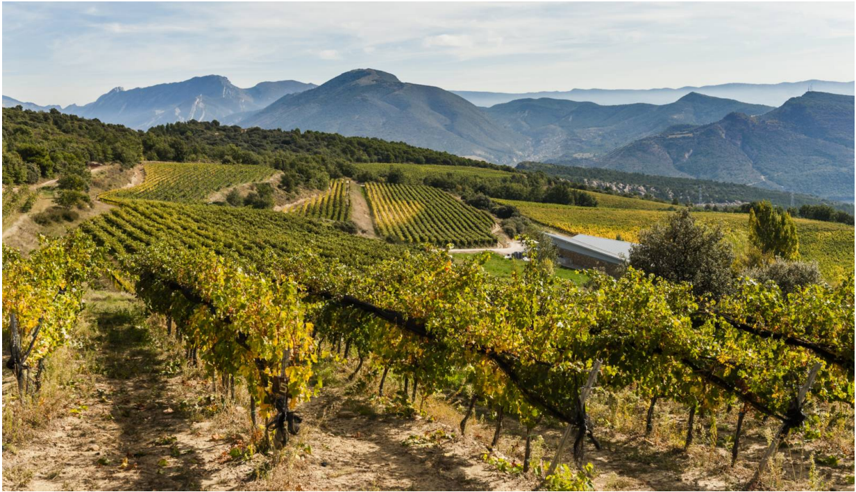
Castell d'Encus