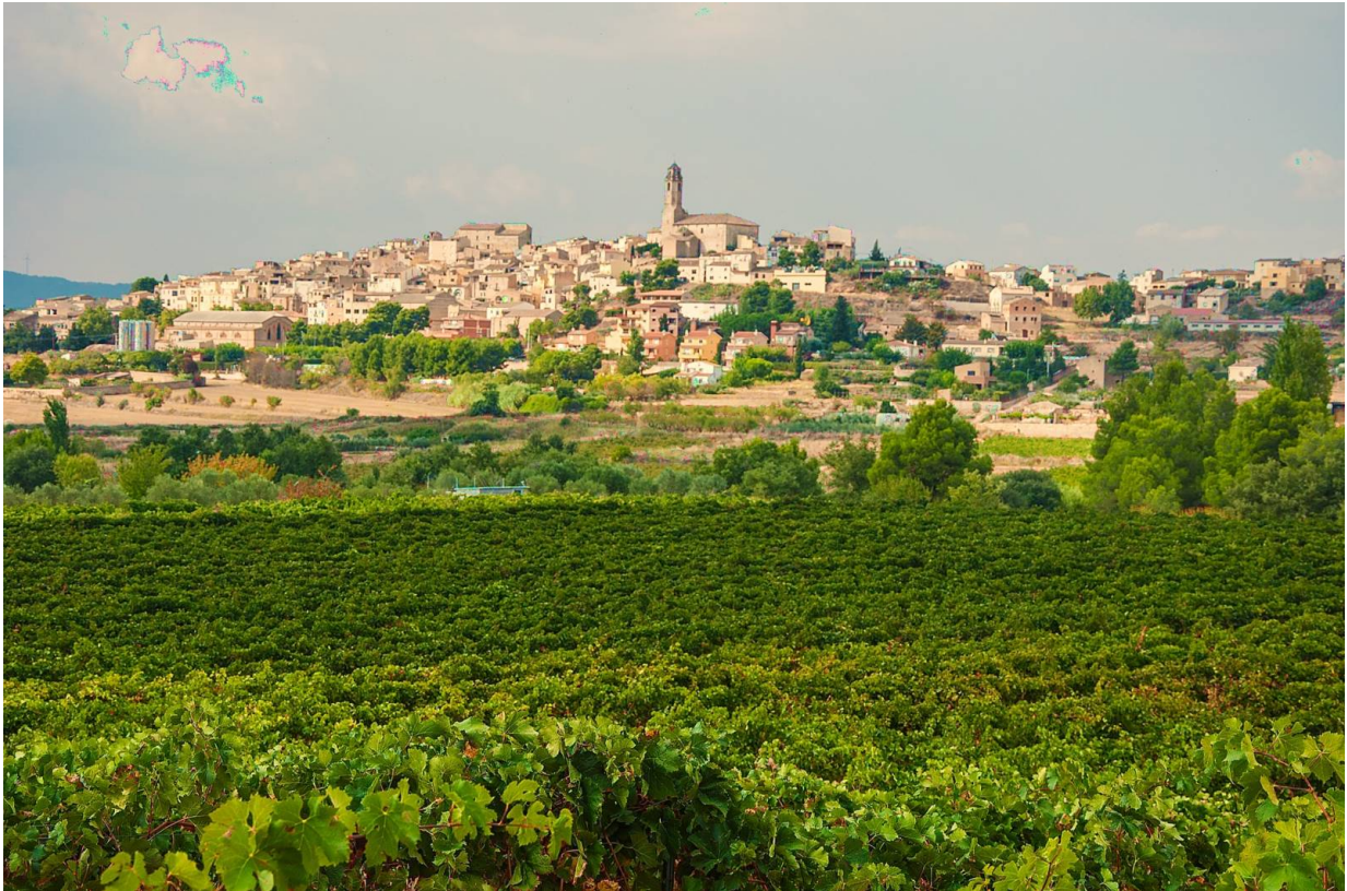
Barberà de la Conca