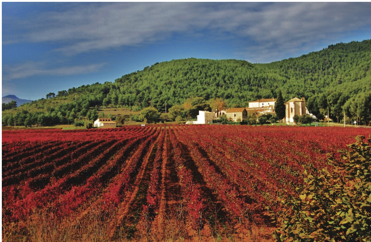
Aiguaviva © Maria Rosa Ferré