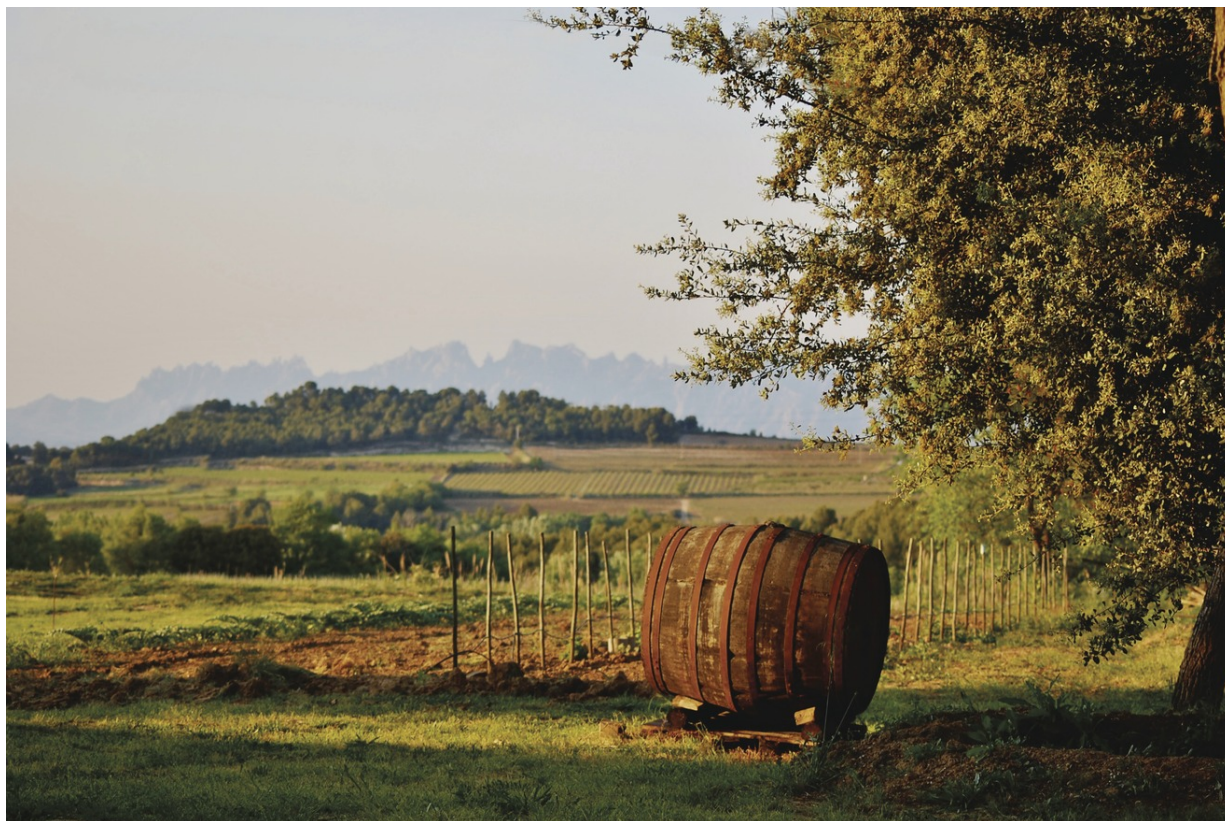
Avinyonet de Penedès