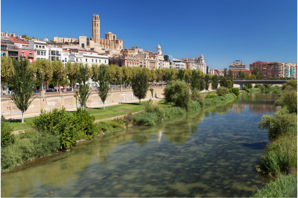
Die Stadt Lleida liegt am Fluss Segre