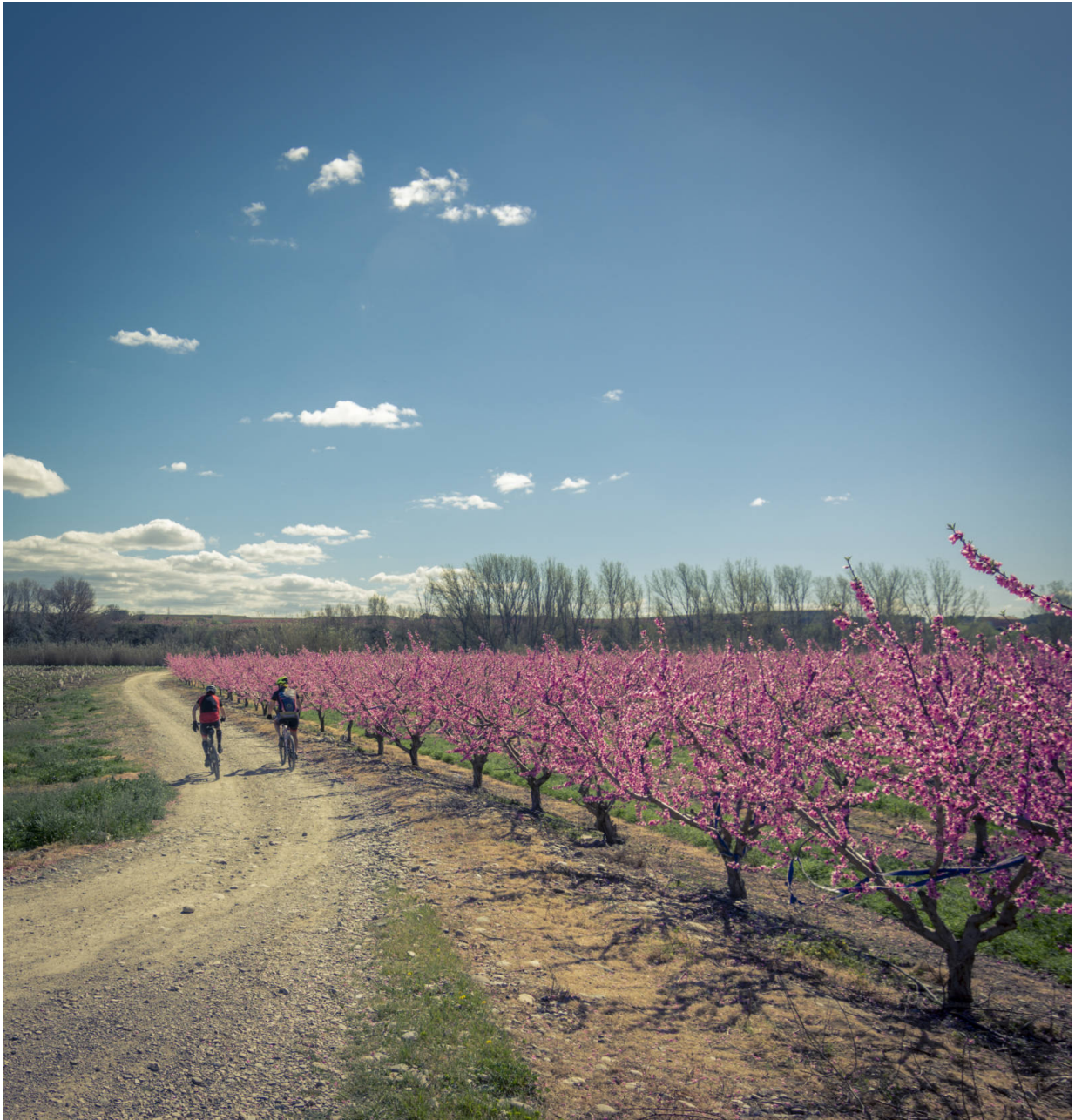
Die Felder Aitonas bei Lleida.

Das ganze Jahr über wird von der örtlichen Gemeinde eine für Familien absolut empfehlenswerte Aktivität organisiert: Fruiturisme. Die Erkundung dieser bunten Gegend steht dabei im Vordergrund, um alles rund um den Bewässerungsfeldbau in Erfahrung zu bringen. Die hervorragende Qualität und die Geschmacksvariationen von (Platt-)Pfirsichen, Nektarinen und Äpfeln entdeckt man in lokalen Restaurants, die oftmals besondere Menüs anbieten.