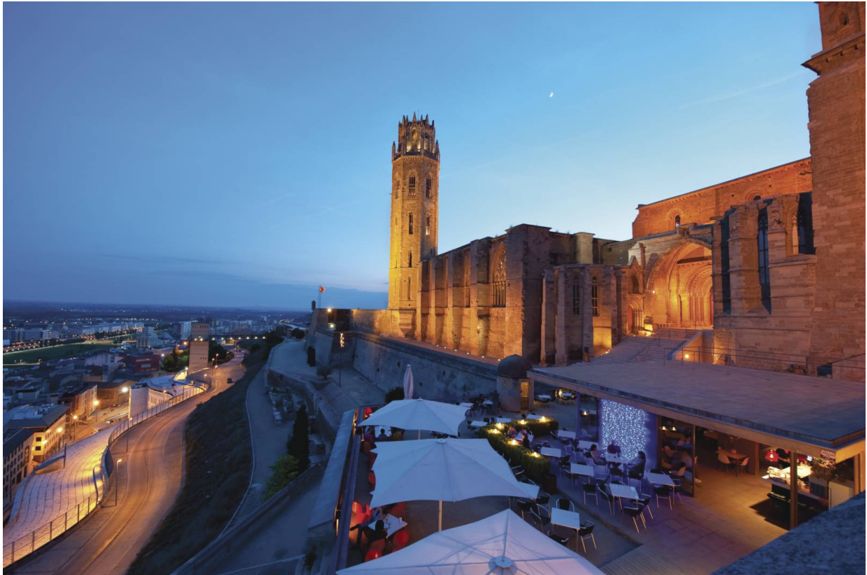
Nächtliche Aufnahme der Kathedrale Seu Vella

□ Auskunft zu Besichtigungen für die ganze Familie erhalten Sie unter turoseuvella@turoseuvella.cat .