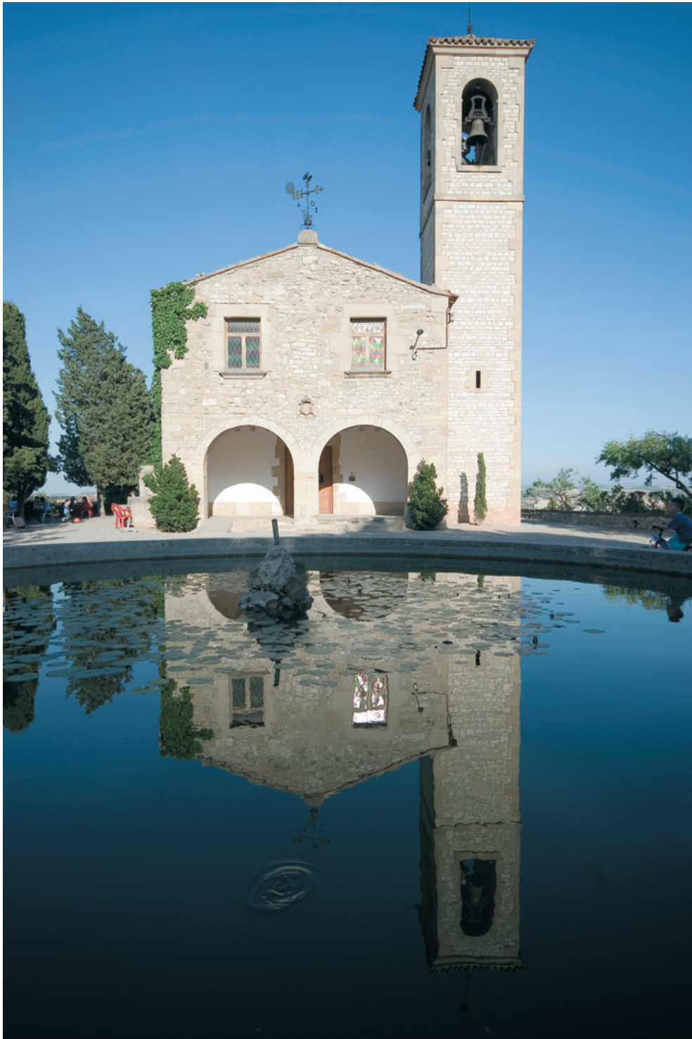
Tàrraga - Katalonien

Palau dels Marquesos de la Floresta, ein ehemaliges Pilger-Hospital und beeindruckendes Beispiel für die Architektur der katalanischen Romanik oder die Kirche Santa Maria d'Alba im neoklassizistischen Stil.