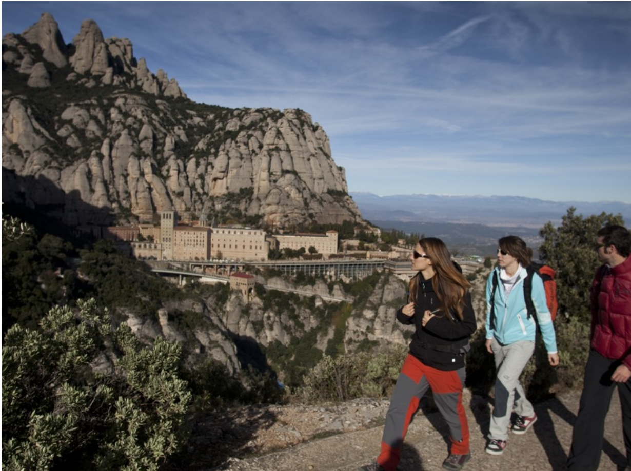
Montserrat – Katalonien