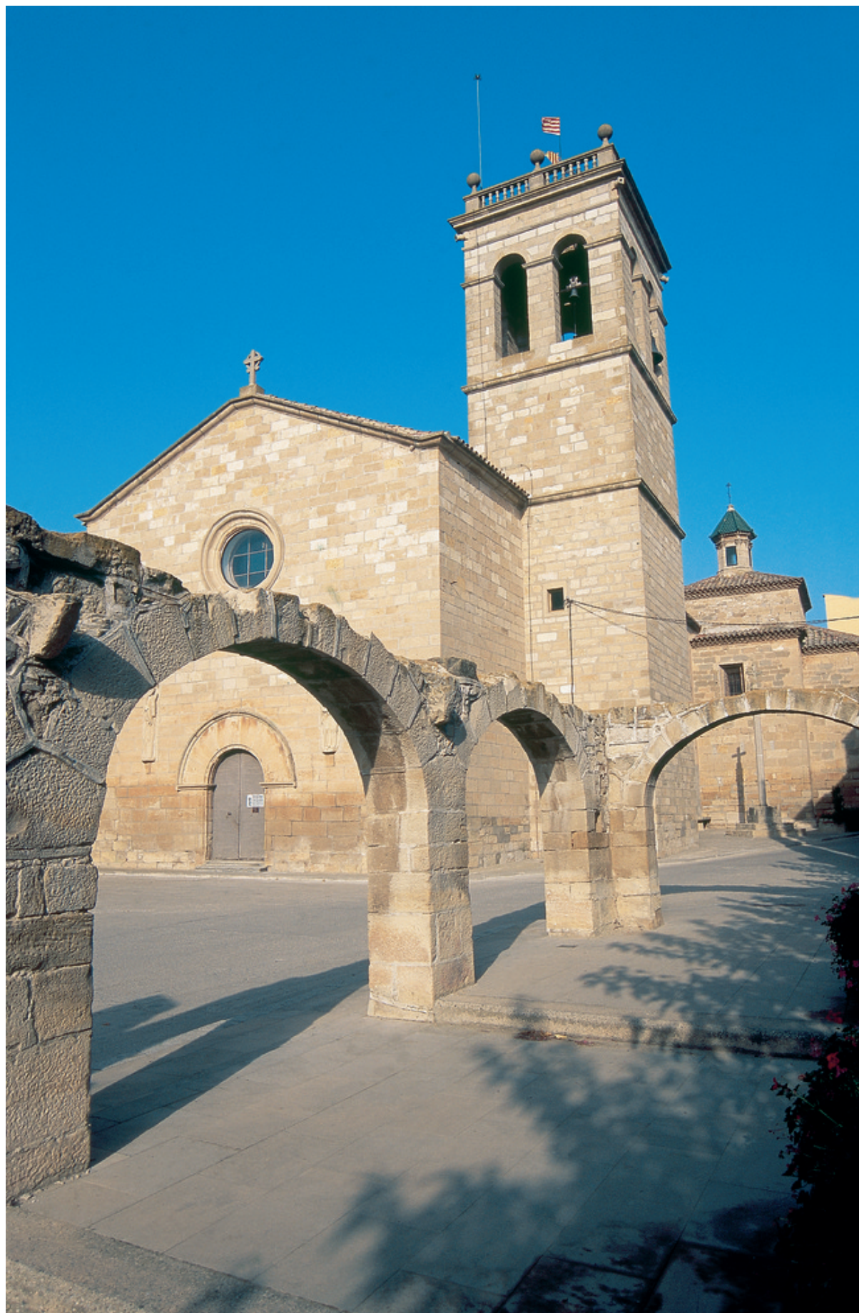
Església de Sant Pau de Narbona, Anglesola