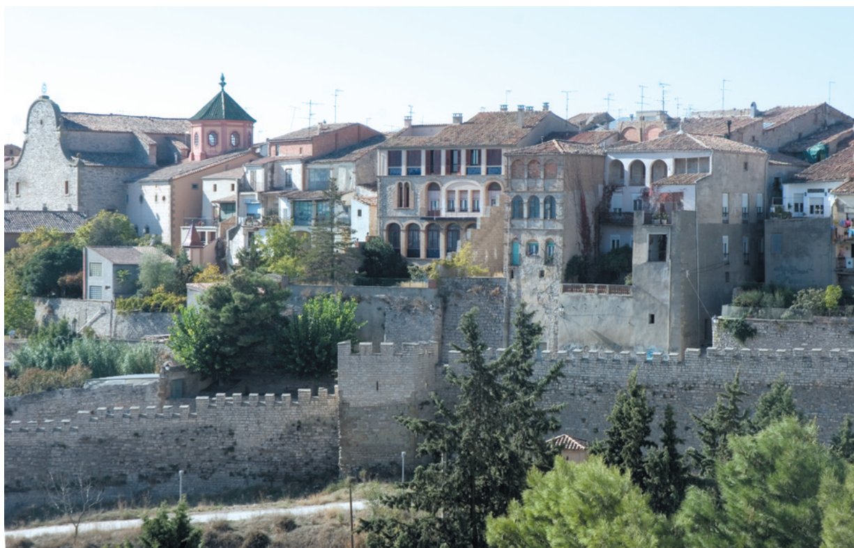
Cervera – Katalonien

und dem alte Universitätsgebäude, das Cervera für lange Zeit zu einer der bedeutsamsten Städten der Region machte. Mit dem Sindicat verfügt auch Cervera über ein von Cèsar Martinell gestaltetes Monument des Modernismus. Weitere Sehenswürdigkeiten sind das im Barockstil gehaltene Rathaus, verschiedene kleine Kapellen und Kirchen sowie der Gebäudekomplex der Gesellschaft Jesu.