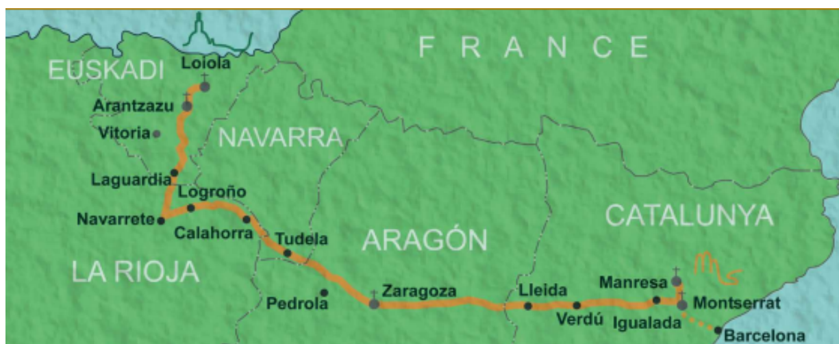
El Camí Ignasià a Catalunya / The Ignatian Way in Catalonia

El Camí Ignasià, der Weg des Heiligen Ignatius, bietet uns Heutigen die Möglichkeit einer stillen und innigen Pilgererfahrung abseits der Ströme des Pilgertourismus. Er durchquert das Baskenland sowie die Regionen Rioja, Navarra und Aragón, um schließlich in Katalonien den Zielpunkt einer spirituellen Reise zu finden, die anzutreten immer mehr Menschen sich wünschen. Innerhalb Kataloniens führt der Ignatiusweg von den Terres de Lleida durch die Landkreise Segrià, Pla d'Urgell, Urgell, Segarra, Anoia und Bages bis nach Zentralkatalonien. Als Pilgerweg, der zu Fuß, zu Pferd oder mit dem Fahrrad begangen werden kann, ist der Ignatiusweg eine spirituelle Reise und ein Weg zu persönlichem Wachstum. Darüber hinaus ist er jedoch auch eine großartige Möglichkeit, Schönheit und Reichtum der katalanischen Landschaften und ihre einzigartigen Natur- und Kulturschätze kennenzulernen.