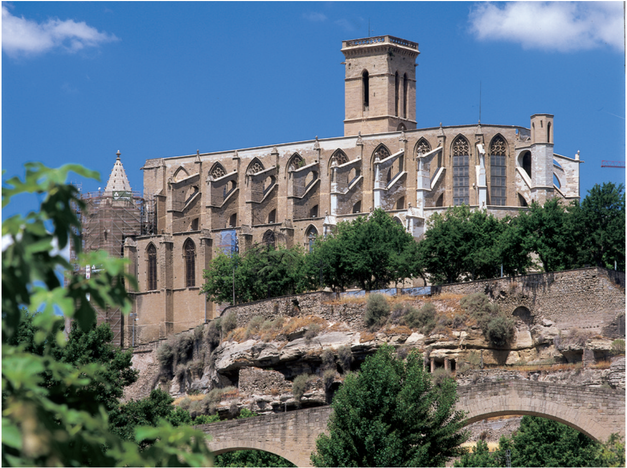
Manresa – Katalonien