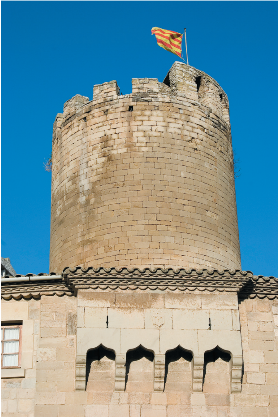
Castell de Verdú