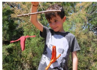
Kinder lieben MónNatura

Ein idealer Ort fürs Birdwatching ist auch das Vogel-Beobachtungshäuschen bei den alten Salinen von Sant Antoni. Hier kann man Sumpfläufer, Fluss-Seeschwalben, Säbelschnäbler und Möwen beobachten. Außerdem gibt es hier Informationen über das Projekt LIFE Delta Lagoon. Dies ist insofern interessant, als das Delta im Zuge des Projektes rekultiviert wurde und deshalb heute eine so fantastische Artenvielfalt aufweist.