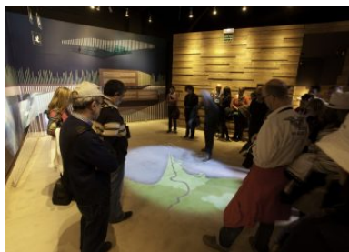
Espai Delta

Espai Delta ist das Interpretationszentrum des Deltas. Es ist das Tor zur Essenz des Deltas, denn es gibt Einblicke in die Traditionen, die Naturschätze und die unterschiedlichen Gesichter des Ortes im Wandel der Jahreszeiten. Überdies ist Espai Delta mit allen technologischen Raffinessen des 21. Jahrhunderts ausgestattet. Audiovisuelle Installationen machen eine Reise in die Vergangenheit des Deltas zu einer nachhaltig sinnlichen Erfahrung. Ein halbgeschossener Raum dient als Vogelobservatorium mit Blick auf die Laguna de L'Alfacada. Somit sind im Espai Delta auch jenseits der Virtuellen Realität spannende Erlebnisse zu erwarten.