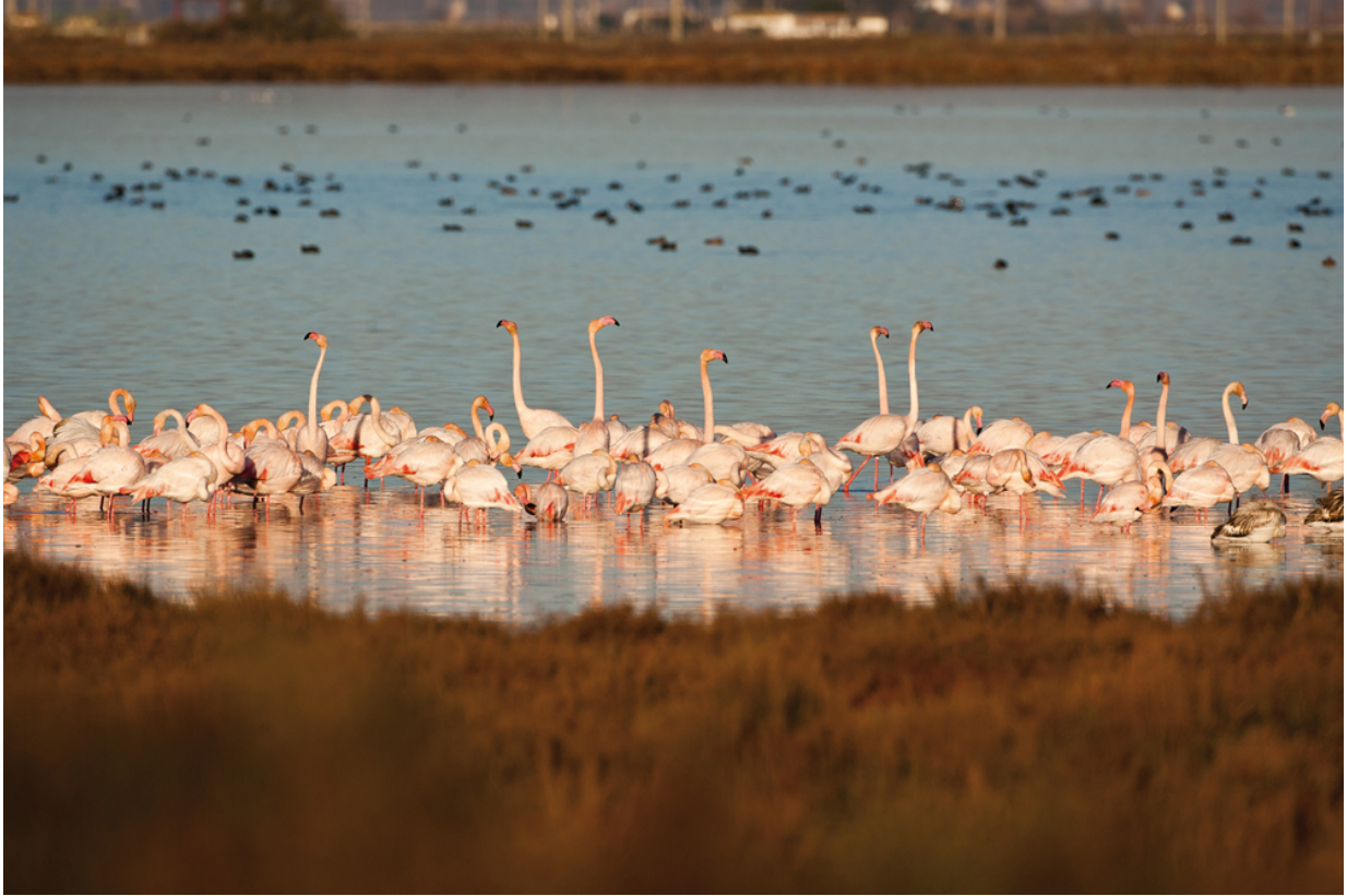
Glamour pur in geschützter Natur: Flamingos am Ebrodelta