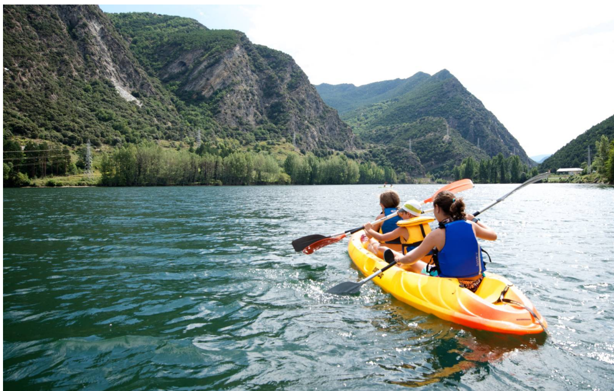
Wassersporta am See La Torrassa

Wer glaubt, die Valls d'Àneu seien im Winter besonders spannend und unterhaltsam, der hat natürlich recht. Das Gleiche lässt sich allerdings auch über die Sommermonate sagen. Denn wenn die Skisaison zu Ende geht, beginnt auch schon fast die Wassersportsaison. Der Torrassa-See ist ein echtes El Dorado für Wassersportler, sei es im Kanu, Kayak oder beim SUP. Wer es noch ein bisschen abenteuerliche mag, darf natürlich auch die Wildwasser-Aktivitäten ausprobieren. Infos gibt es hier .