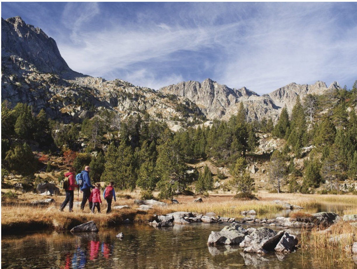
Wanderwege für Familien im Nationalpark Aigüestortes i Estany de Sant Maurici

Und so gibt es hier eine ganze Reihe von Wanderrouen, die kurz, knackig, atemberaubend, garantiert nicht langweilig und absolut kindertauglich sind. Zum Beispiel die Wanderung zum Sant Maurici-See, der auf einer Höhe von 1910m in einem Talbecken liegt. Vom Wanderparkplatz aus braucht man mit Kindern etwa zwei Stunden. Und falls ihre Sprößlinge weite Wanderstrecken nicht gewohnt sind, bietet sich jederzeit die Möglichkeit, auf das Geländewagentaxi auszuweichen. Es fährt zu jeder vollen Stunde und kostet 4,35€ pro Strecke. Und natürlich bietet der Nationalpark auch noch eine ganze Menge weiterer toller Wandermöglichkeiten für Familien. Wer sich über aktuelle Angebote informieren möchte, schaut hier oder hier .