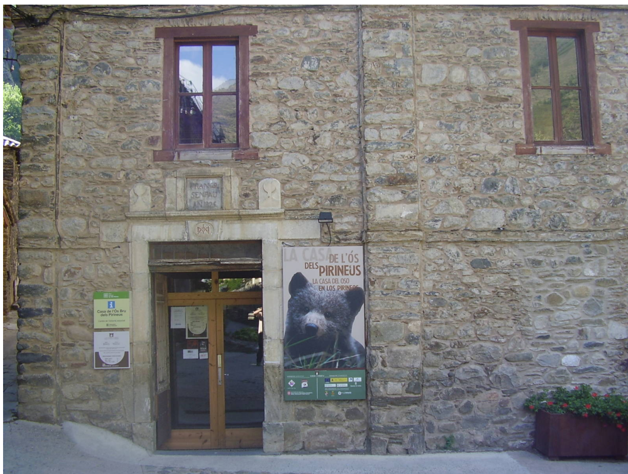
Casa de l'os

Casa Sastrès d'Isil in Pallars Sobirà ist ein Haus in traditioneller Pyrenäenarchitektur, erbaut aus Stein, Schiefer und Holz. Überdies ist es heute auch ein Interpretationszentrum des Braunbären. Seit einigen Jahren ist der Braunbär in den Pyrenäen wieder heimisch. Im Rahmen des Projektes PIROSLife strebt man ein friedliche Miteinander von Hirtenkultur und Wildleben an. Das Haus des Braunbären gibt spannende Einblicke in das Leben der Braunbären und in die Pyrenäen als ihren Lebensraum. Ausgehend vom Museum gibt es auch eine Reihe von Wanderwegen, die diesem Thema gewidmet sind. Nicht zuletzt kann man hier in Begleitung erfahrener Führer auch den Spuren des Braunbären folgen. Weitere Infos gibt es hier .