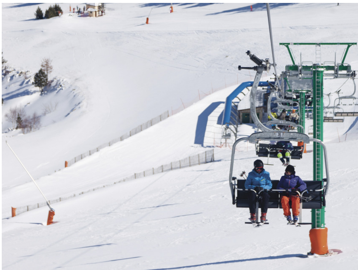
Skistation Espot

Eigentlich hatten Sie schon immer mal vor, das Skifahren zu lernen – aber irgendwie ist es nie dazu gekommen? Dann aufgepasst. Vielleicht erfüllt sich ihr lange gehegter Wunsch am Ende nicht in den Alpen, sondern auf der Iberischen Halbinsel in den Pyrenäen von Lleida. Hier bietet die Skistation Espot Skieinführungskurse für die ganze Familie an. Kinder ab sechs Jahre und ihre Eltern erlernen hier in etwa drei Stunden die wichtigsten Grundlagen des Skifahrens. Skischuhe auswählen, die Ausrüstung zur Piste bringen, in den Sessellift steigen und im Pflug runterfahren sind die ersten Schritte auf dem Weg ins selbständige Skivergnügen. Ein erfahrener Skilehrer zeigt und erklärt die wichtigsten Techniken. Nach einige Runden in Begleitung des Lehrers, trauen sich die Skieinsteiger dann in der Regel schon alleine auf die blauen Pisten.