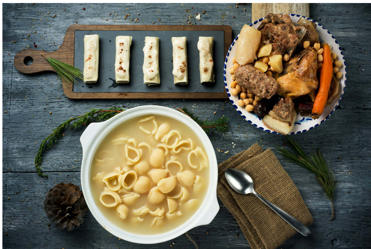
Herzhafte katalanische Küche.

Viel Bewegung an frischer Luft macht hungrig. In den Valls d'Àneu ist das ein hochwillkommenes Gefühl. Die herzhafte Pyrenäenküche schmeckt nämlich mit wirklich hungrigem Magen am Allerbesten. Ein Klassiker ist der katalanische Eintopf aus dem Tontopf – schön warm und mit unverwechselbarem Aroma. Wer's ein bißchen ausgefallener mag, kann hier auch Wildschwein kosten – und schlemmen wie Asterix und Obelix nach einer ihrer legendären Begegnungen mit dem Römern. Infos gibt es hier .