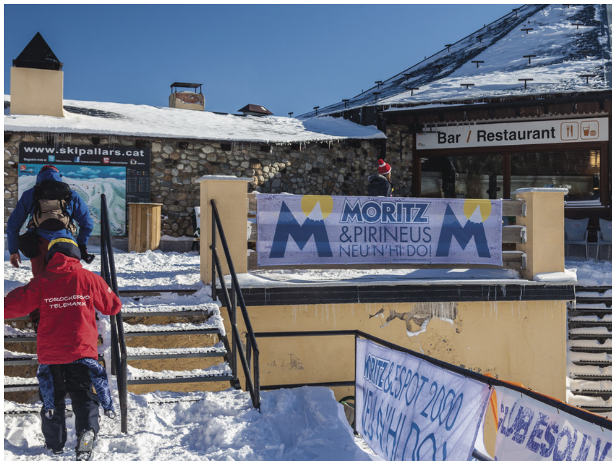
Die Skistation von Espot bietet Wintervergnügen für Familien