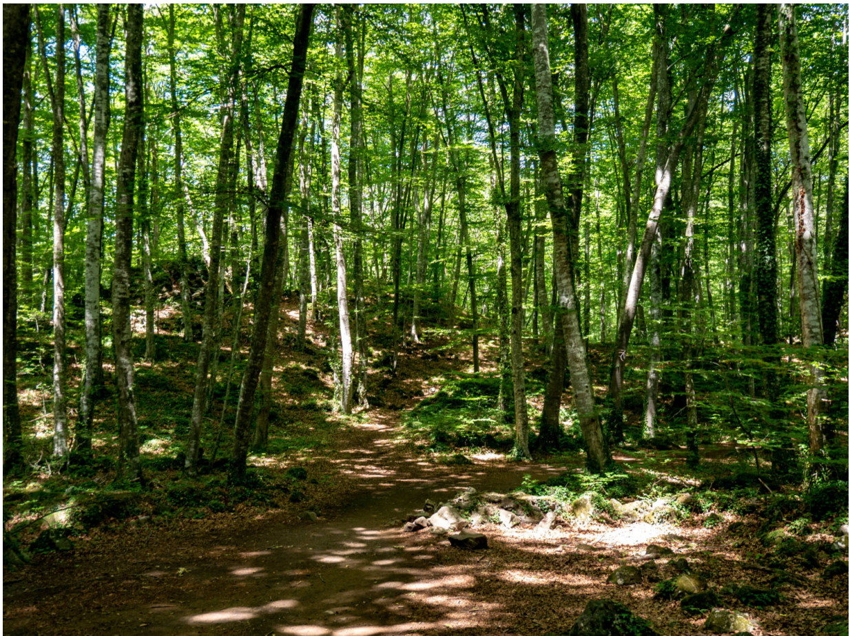
La Fageda d'en Jordà

Sanfte grüne Hügel prägen das Bild der Garrotxa. Unter dem malerischen Äußeren hütet die Region auf halbem Weg zwischen den Buchten der Costa Brava und den Gipfel der hohen Pyrenäen jedoch ein feuriges Geheimnis. Insgesamt 40 Vulkane und ihre Lavaströme haben diese einzigartige Landschaft geformt, die seit 1982 als Naturpark unter Schutz steht. Heute sind die Vulkane bedeckt von tief grünen Wäldern, zwischen die sich Felder, Weiden und Wiesen schmiegen. Zu den Wahrzeichen der Garrotxa gehören die Vulkane Croscat und Santa Margarida, sowie der zauberhafte Buchenwald Fageda d'en Jordà.