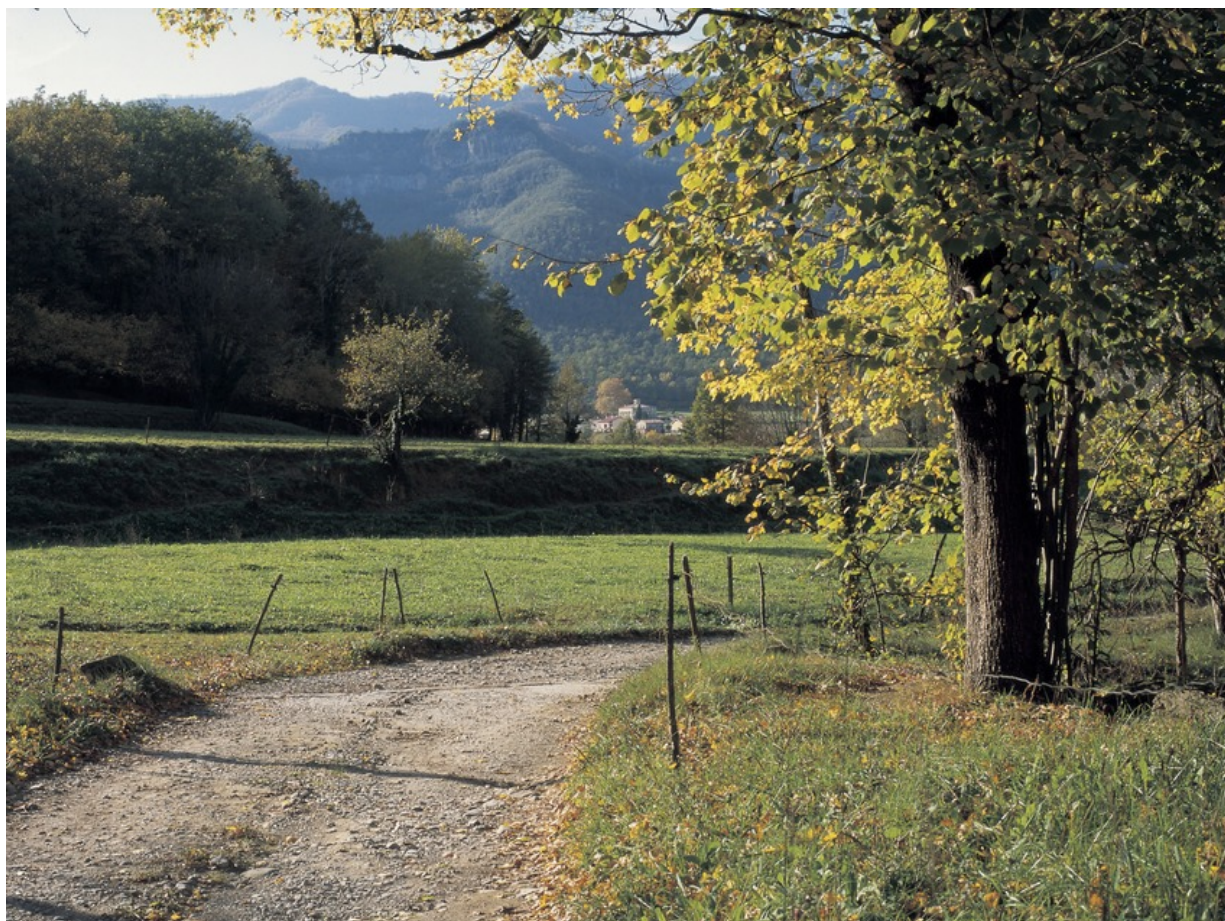
Camí ral a prop dels Hostalets d'en Bas

Berglandschaft mit ihren tiefen Wäldern und grünen Weiden, hütet der historische Weg einige Spuren der Vergangenheit. Zu diesen gehört natürlich das alte Kopfsteinpflaster des Camí ral selbst. Überdies ist aber zum Beispiel auch ein Versteck der Wegelagerer zu entdecken, welche den Reisenden auf dem Camí ral aufzulauern pflegten. 500m Höhenunterschied auf einer Streckenlänge von elf Kilometern stellen an die Kondition mittlere Anforderungen. Schwindelfrei sollte man allerdings sein, denn der Weg führt entlang einiger Steilklippen.