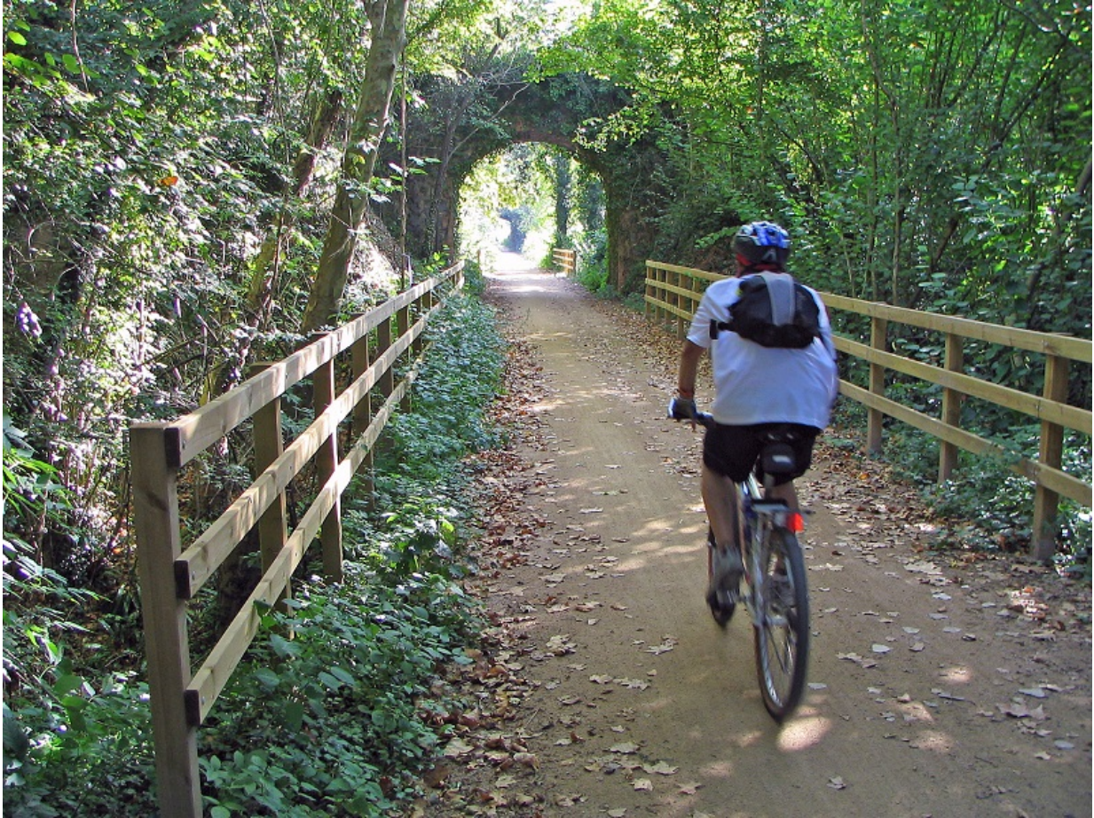
Via Verda del Carrilet I