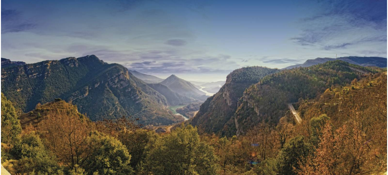
Blick auf Stausee La Baells von Sant Corneli

Berga ist als Reiseziel für Familien zertifiziert. Neben einem breiten Angebot an Aktivitäten für Familien garantiert die Stadt somit auch familienfreundliche Unterkünfte und Restaurants. Weitere Infos gibt es unter http://www.turismeberga.cat