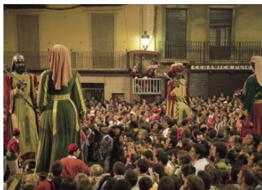
Die Patum