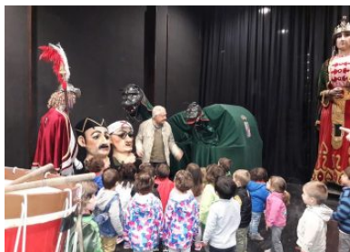
Casa de la Patum