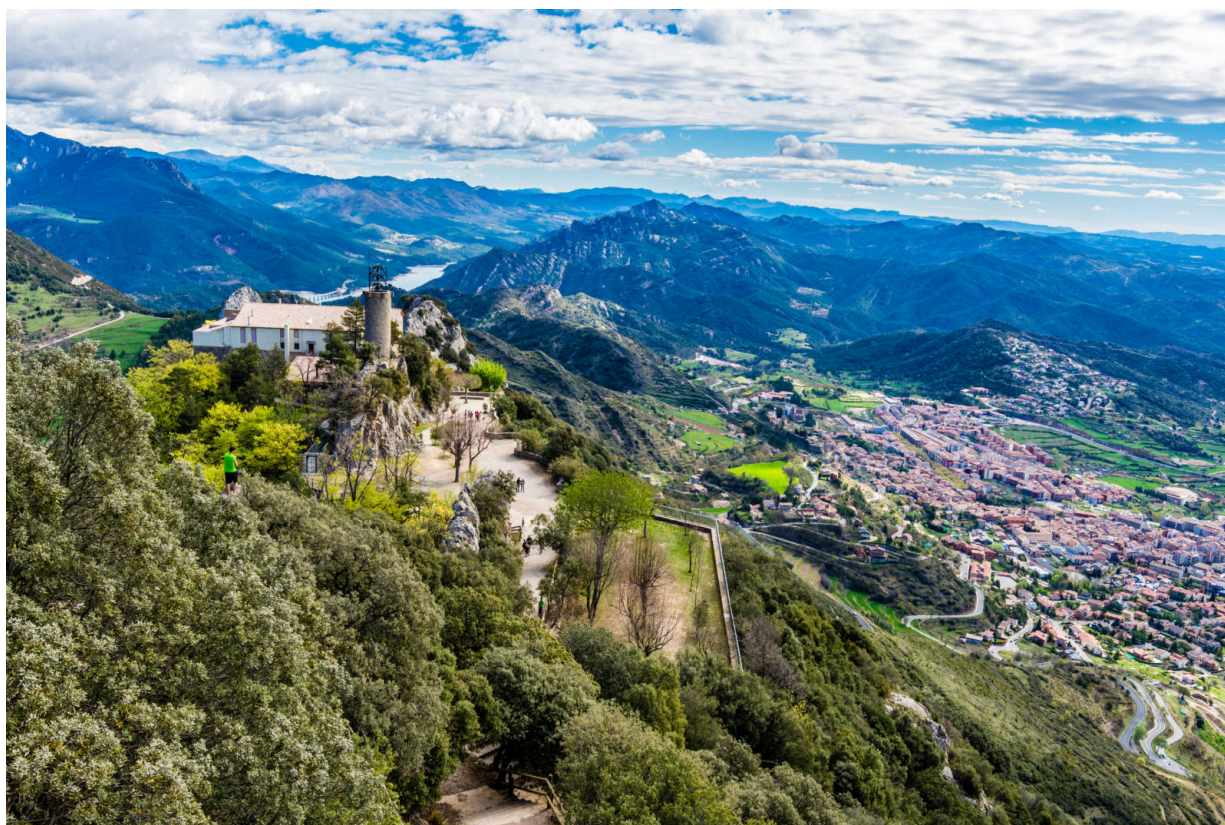
Berga - Eine Stadt mit Herz für Familien in traumhafter Lage

malerischen Serra de Queralt mit Blick auf das Tal des Llobregat macht Berga zum perfekten Ausgangspunkt für unvergessliche Ausflüge mit der Familie. Hier kann man die 65 Millionen Jahre alten Fußspuren von Dinosauriern bestaunen, in die Schächte der Minen einfahren, die das Leben der Region so lange bestimmten oder per Kayak oder Kanu den überragend schönen Stausee La Baells erkunden. Die Serra de Queralt vom Rücken der Pferde aus zu entdecken, ist eine weitere wundervolle Option. Falls Sie jedoch lieber selber die Hufe schwingen, bietet die Region auch schöne Wanderwege für Familien. Wir stellen Ihnen hier unsere Top 5 für Familien in Berga vor.