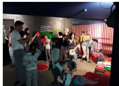
Colec.ció del Circ