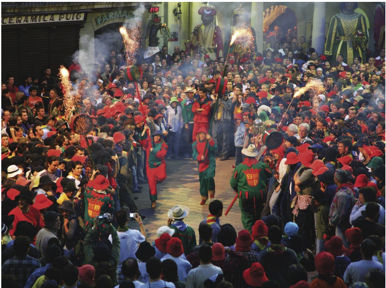
Die Patum

Den Landkreis Berguedà mit der ganzen Familie erkunden? Hier klicken!