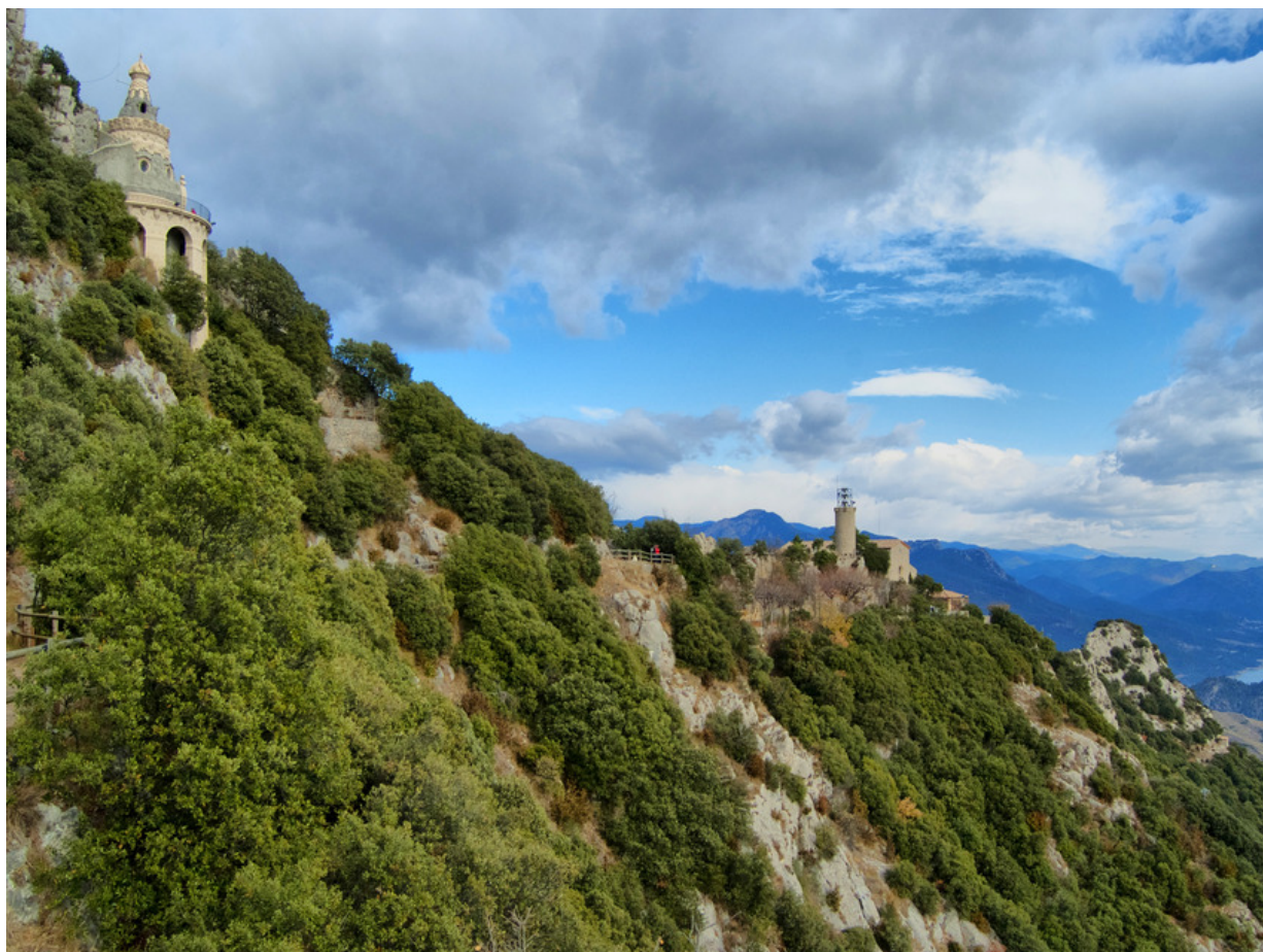
Blick vom Santuari de Queralt

Berga ist umgeben von herrlichen Naturlandschaften. Die Serra de Queralt mit zerklüfteten Gebirgszügen und artenreichen Wäldern, ist ein Wandergebiet voller spannender Touren. Uralte Kirchen und Kapellen fügen sich ein in eine Landschaft der Kontraste. Schattige Buchenwälder sind hier ebenso zu finden, wie mediterrane Pinienwälder mit ihrem einzigartigen Duft. Dieser Abschnitt der Vorpyrenäen ist zweifellos mehr als einen Ausflug wert.