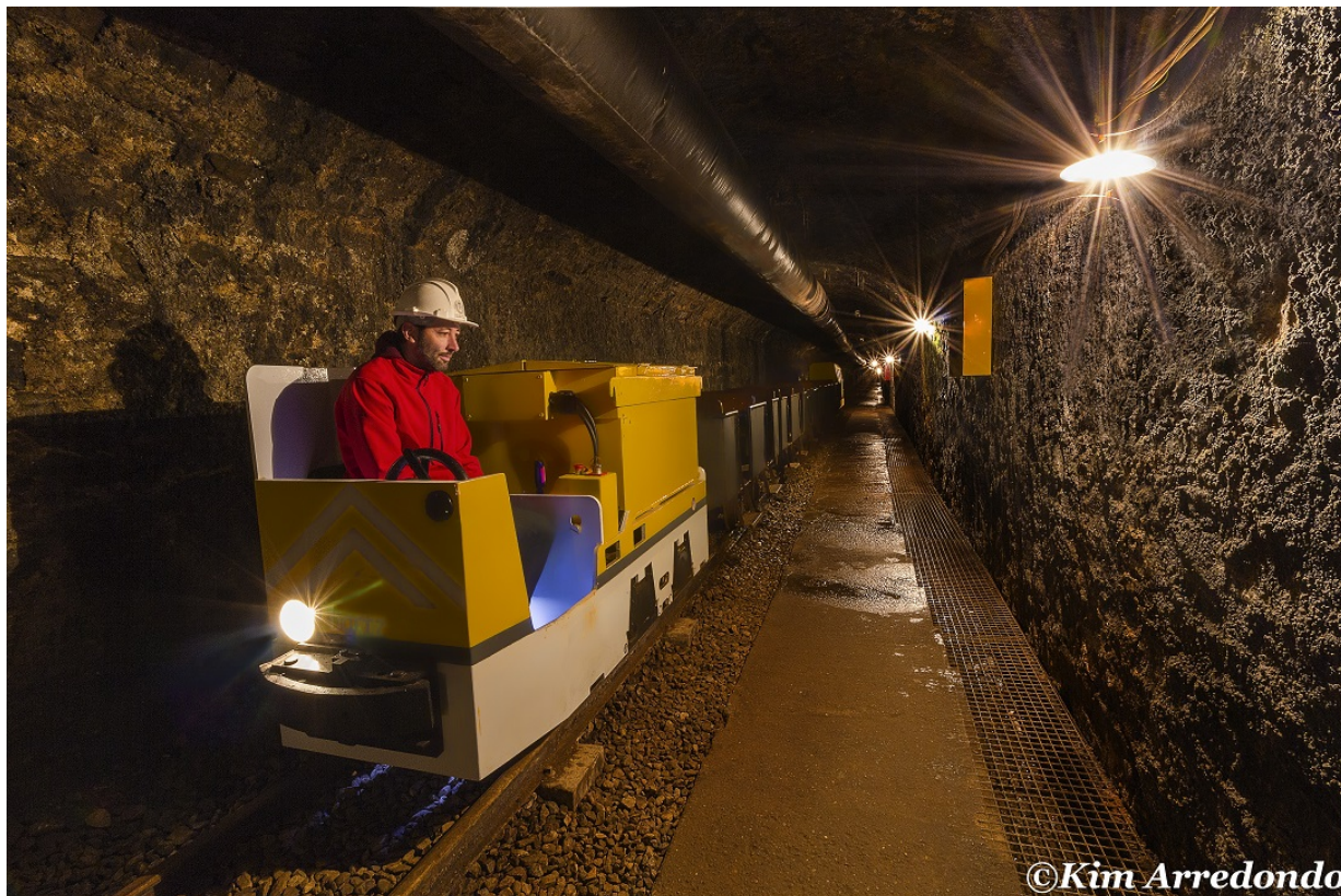
Museu de les Mines de Cercs

Museen sind entweder langweilig und verstaubt, oder so überlaufen, dass man sowieso nicht viel mehr als den Rücken seines Vordermannes zu sehen bekommt? Weit gefehlt! Viele Museen der Provinz Barcelona sind gefühlt eher Abenteuerspielplätze als trockene Ansammlungen von Ausstellungsstücken und der perfekte Ausgangspunkt für Reisen in vergangene Epochen und fremde Welten. So gewinnt man zum Beispiel bei einem Besuch der Minen von Cercs nicht nur Einblicke in das zwischen Stollen und Industriekolonie sich abspielende Leben der Arbeiter, sondern entdeckt auch die Spuren der Dinosaurier, die vor etwa 66 Millionen Jahren im Bergueda lebten.