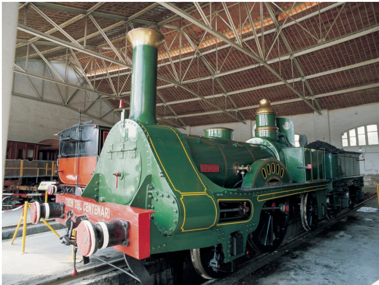
Eisenbahnmuseum in Vilanova i la Geltrú

Begeistern Sie sich für historische Eisenbahnen? Den mystischen Klang einer hupenden Dampflok, das hypnotische Rattern der Räder auf den Schienen? Die Geschichte der Dampflok, die wie wenige andere Erfindungen die Geschichte der Menschheit geprägt hat? Es gibt viele gute Gründe, sich für historische Eisenbahnen zu begeistern und in der Provinz von Barcelona gibt es fast genauso viele Möglichkeiten, seine Liebe zur Dampflok im Urlaub einmal richtig auszuleben. Schließlich verkehrte der erste Zug auf der Iberischen Halbinsel zwischen Barcelona und Mataró. Grund genug für die Bewohner von Mataró, in Erinnerung an dieses historischen Ereignisses jedes Jahr ein riesiges Eisenbahnfest zu feiern. In Vilanova i la Geltrú lockt das Eisenbahnmuseum mit einer umfangreichen Kollektion von Dampflokomotiven, in Igualada entzückt das Miniatur-Eisenbahnmuseum nicht nur begeisterte Modellbauer.