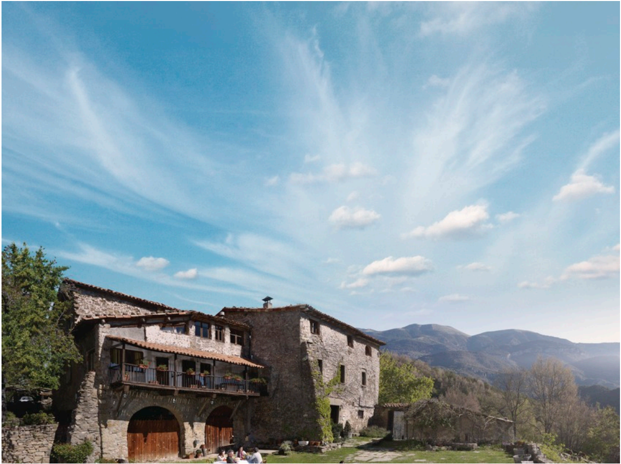
Landlust an der Costa Barcelona

Vielleicht stellen Sie ja bei Ihrem Ausflug in die Weinberge fest, dass Sie mit Ihren Kindern gerne noch ein bisschen mehr Landleben fernab der typischen Touristenorte genießen möchten. Dann könnte ein Aufenthalt in einem der typischen traditionellen Bauernhäuser des Hinterlandes der perfekte Urlaubsort für Sie sein. Auf einem Bauerngut, der sogenannten Masia, teilen sie das Haus mit seinen Bewohnern und können im täglichen Zusammenleben mit Ihren Gastgebern viel Interessantes über das Landleben und die Tiere erfahren. Wer lieber ein Landhaus für sich ganz alleine möchte, der mietet eine Masoveria und genießt den Reiz des Landlebens für sich alleine. Unterkünfte in Masias und Masoverias gibt es in vielen Gegenden des abwechslungsreichen Hinterlandes der Costa Barcelona. Die Spannweite reicht dabei von Weingütern zwischen Reben über traditionsreiche Höfe mit Pferdeställen und kleine Bauernhöfe, auf denen die Kinder helfen dürfen, Hühner, Enten und Gänse zu füttern. Weitere Infos gibt es hier .