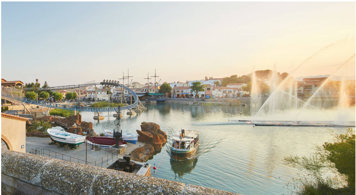
Themenwelt Mediterrània

Als größtes Familien-Resort im Mittelmeerraum ist PortAventura World ein Highlight der Costa Daurada. PortAventura World Parks & Resort liegt nur eine Stunde von Barcelona entfernt und umfasst gleich drei Themenparks. Der berühmte Klassiker unter ihnen ist Port Aventura Park mit seinen sechs aufregenden Themenwelten. Mit Ferrari-Land hat PortAventura World der technologische Brillanz der Marke Ferrari und dem italienischen Genius ein Denkmal gesetzt. Der Caribe Aquatic Park lädt hingegen ein zu abenteuerlichen Vergnügen im und mit dem nassen Element. Das touristische Angebot wird abgerundet durch sechs Themenhotels. Mit dem Check-In in diesen Hotels erhalten die Gäste während ihres Aufenthalts unbegrenzten Zutritt zum PortAventura Park.