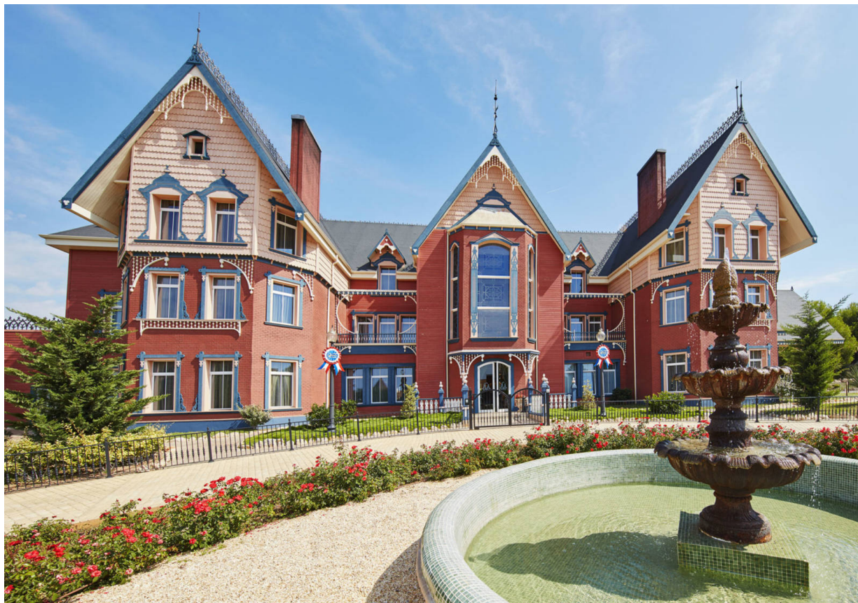
Hotel Mansión de Lucy