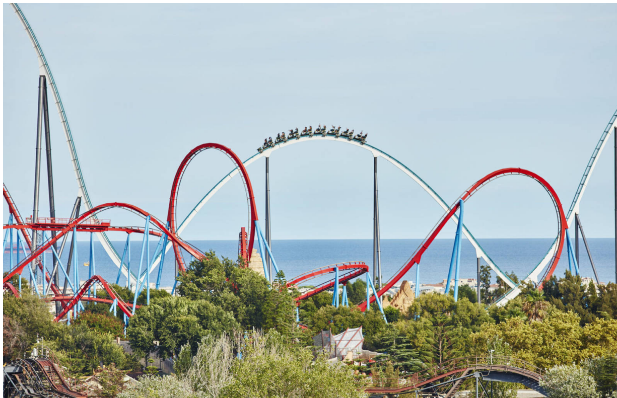
Park China

Die mannigfaltige Attraktionen von PortAventura Park sind sechs verschiedenen Themenwelten zugeordnet: Mediterrània, Polynesia, China, Mexico, FarWest und die Kinderwelt SésamoAventura. Sie entföhren die Besucher in ferne Lnder, exotische Kulturen und natrlich in die unvergessliche Welt der Sesamstrae und ihrer Bewohner. Bei fanatistischen Life-Shows erhaschen die Besucher Einblicke in die Schnheit und Magie der Kulturen und Geschichten der Welt. Insbesondere die Themenwelt SésamoAventura verzaubert auch die jngsten Besucher des Parks. Mit StreetMission bietet SésamoAventura nun auch ein interaktives Familienabenteuer voller Spannung und unglaublicher Erfahrungen. Detektiv Coco bentigt bei seiner geheimen Mission nmlich Untersttzung von mutigen und cleveren Familien. Wer ihm zu Seite stehen mchte, taucht ein in eine technologische Wunderwelt voll immersiver Erfahrungen.