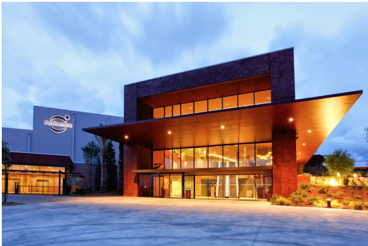
PortAventura Convention Center