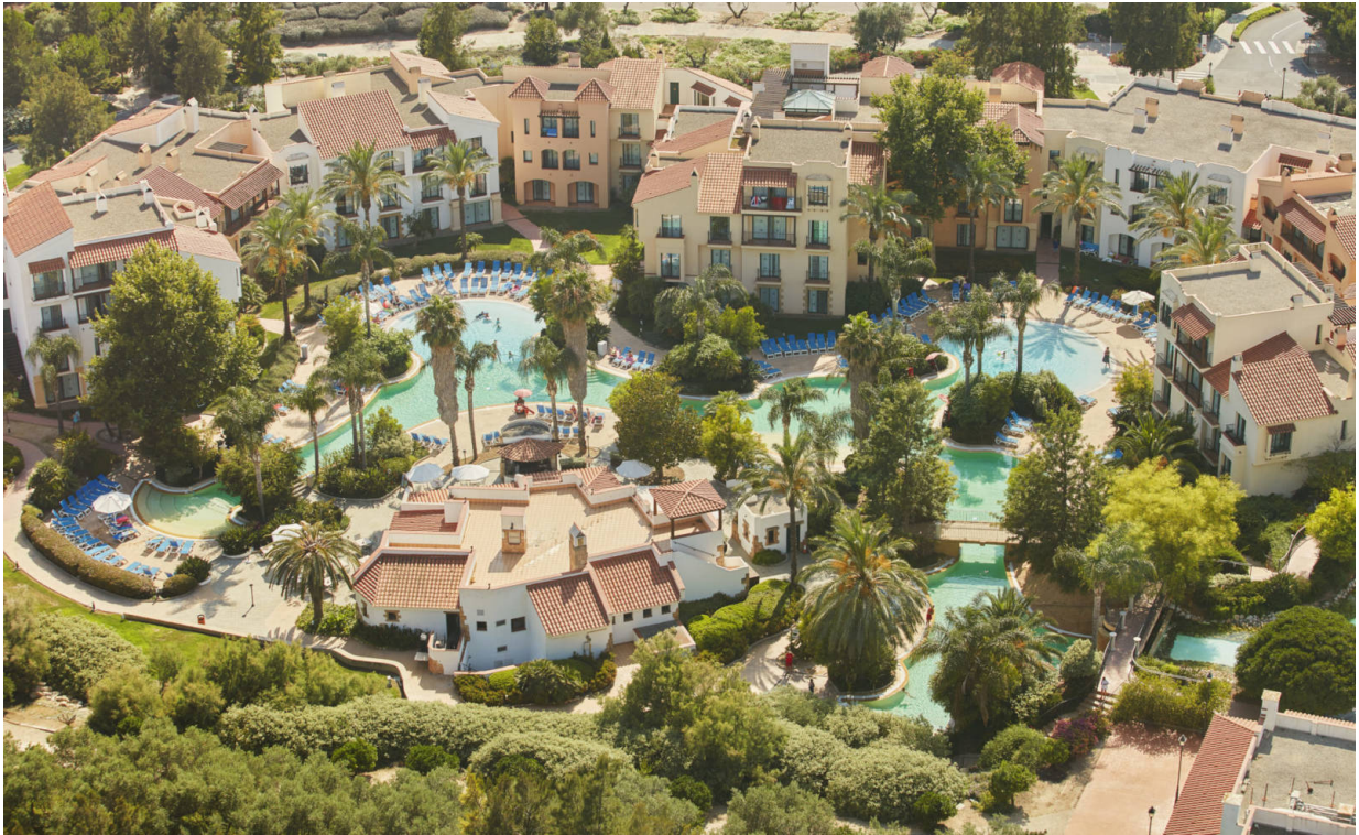
Hotel PortAventura

wunderbare Möglichkeiten zur Ausrichtung von Business-Events in neuen, innovativen Formaten.