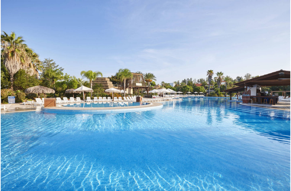
Hotel El Paso