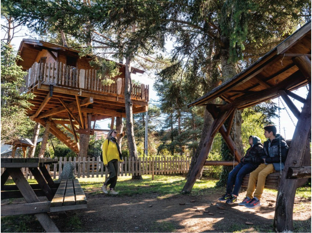
Xalet de Prades – Wohnen im Baumhaus

Muntanyes de Prades, auch Muntanyes Costa Daurada genannt, tragen des Qualitätssiegel „Reiseziel für Familien“. Weitere Informationen zum Familienurlaub in dieser Region finden Sie unter: http://www.muntanyescostadaurada.cat/turismefamiliar/en