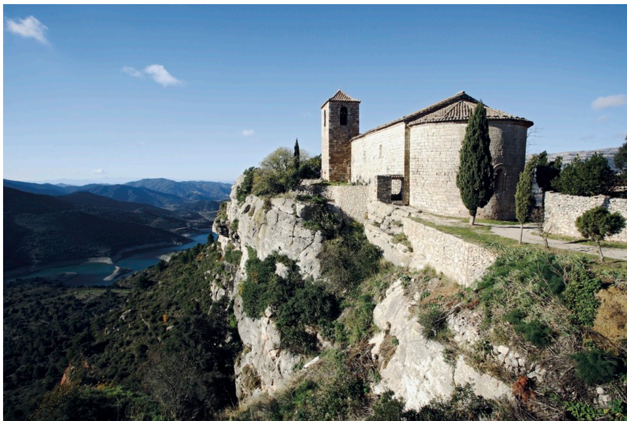
Legendär – Siurana in den Muntanyes de Prades

Ein Felsvorsprung über dem Fluss trägt den Namen El Salt de la Reina Mora, der Sprung der Maurenprinzessin. Er erinnert an Abdelazia, die schöne Tochter des muslimischen Herrschers von Siurana. Als die christlichen Truppen unter Führung von Ramon Berenguer IV die Stadt erreichten, entschied Abdelazia, dass sie lieber sterben als in die Hände der Feinde geraten wollte. Sie trieb ihr Pferd in vollem Galopp auf die Klippe zu. Das Pferd scheute im letzten Moment, doch der Schwung war so mächtig, dass der Fall nicht mehr aufzuhalten war. Pferd und Maurenprinzessin stürzten vom Salt de la Reina Mora in die Tiefe. Daran erinnert bis heute ein Hufabdruck, den das scheuende Pferd hinterließ – so sagt die Legende.