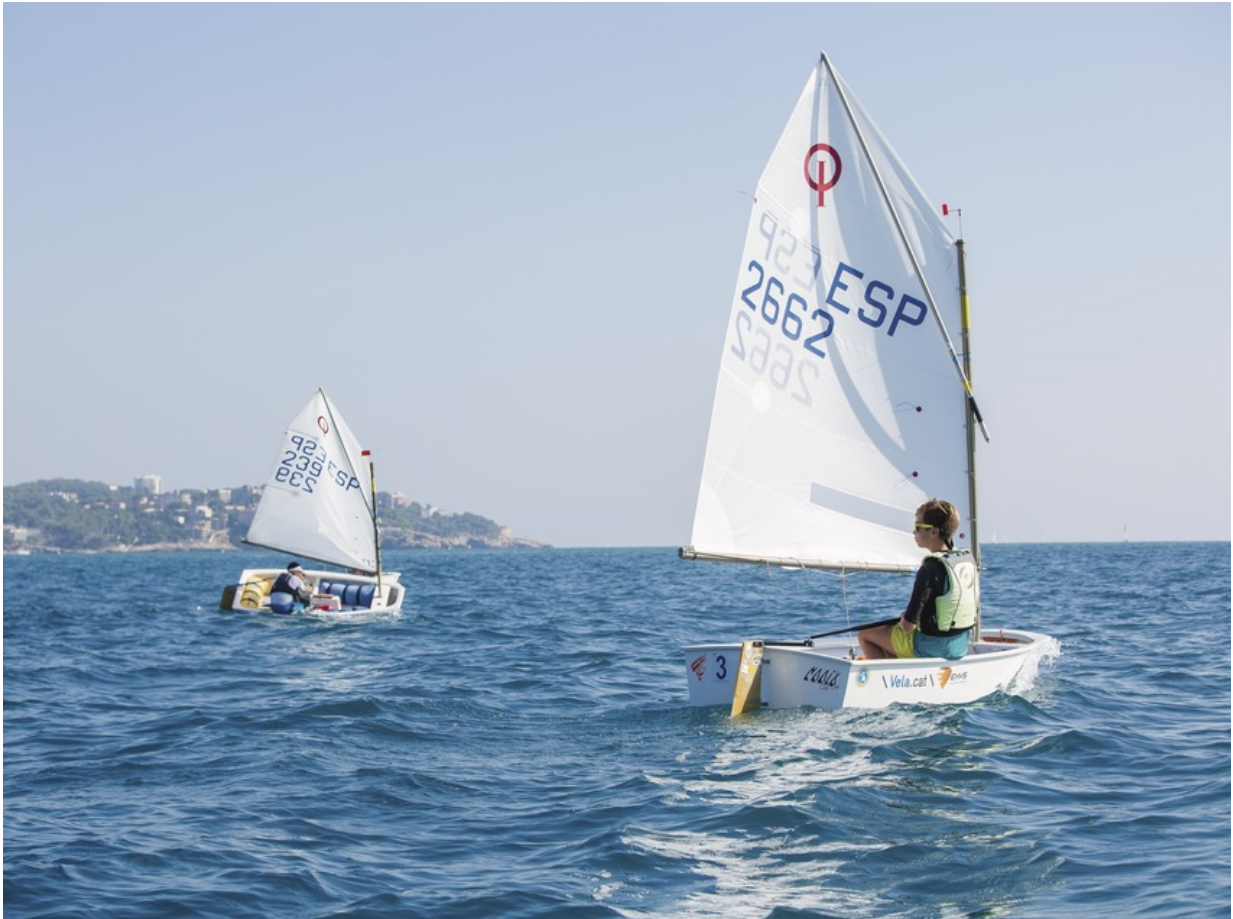
Segeltörn an der Costa Daurada