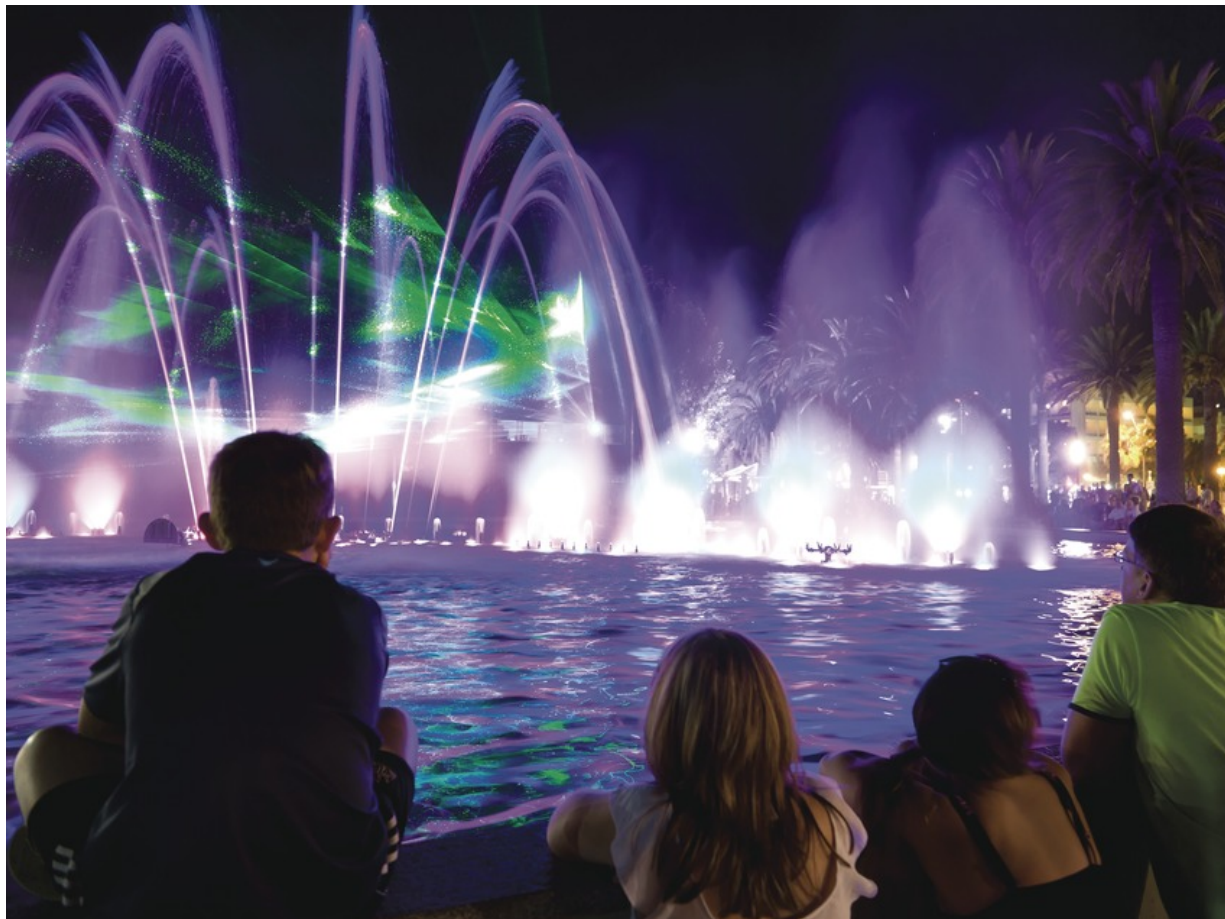
Salou, die Stadt der Springbrunnen

Salou ist die Stadt der Springbrunnen. In den Abendstunden wird das Spiel des Wassers begleitet von Musik- und Lichteffekten. Es gibt beleuchtete, verzierte und bewegliche Brunnen – und sogar Labyrinthbrunnen. Dem Spiel mit dem Wasser kann hier kein Kind widerstehen – und auch Erwachsene haben Spaß, wenn sie sich ihren Weg durchs Wasserlabyrinth suchen.