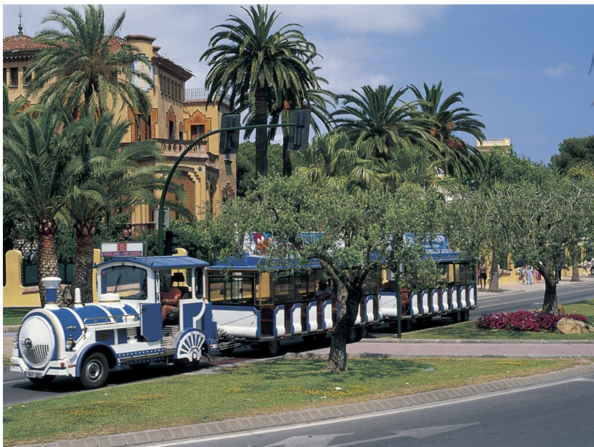
Salou im Touristenzug entdecken

Die Costa Daurada hat Familien viel zu bieten. Eine ganze Reihe von Orten tragen hier das Siegel „familienfreundliches Urlaubsziel“. So hat man reichlich Möglichkeit, den Urlaubsort ganz nach den eigenen Vorlieben zu wählen. Während Salou zu den großen, quirligen Urlaubsorten der Costa Daurada zählt, ist Cambrils ein eher ruhiger Ort. Neben dem Familientourismus, wird hier Sporttourismus ganz groß geschrieben. So ist Cambrils zum Beispiel der ideale Ausgangsort, um das Hinterland der Costa Daurada bei ausgedehnten Radtouren zu erkunden. Wer darüber mehr wissen möchte, kann sich im Cycling Coffee erkundigen oder schaut gleich auf der Website der Agentur Cycling Holidays, die wir hier bereits vorgestellt haben. Vorher jedoch, sollte man natürlich Cambrils erkunden. Wer sich mit der ganzen Familie bequem und vergnüglich einen ersten Eindruck verschaffen möchte, sollte eine Fahrt durch den historischen Stadtkern mit dem Touristenzug von Cambrils buchen. Infos gibt es hier .