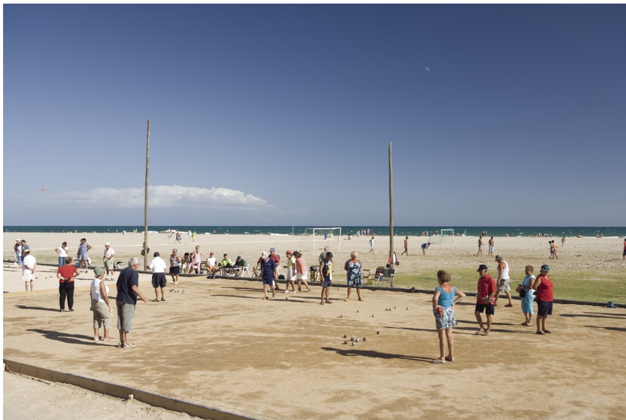
Strand von Calafell

Natürlich hat Calafell noch mehr zu bieten, als Einblicke in seine iberische Vergangenheit. Die geschichtsträchtige Stadt im Herzen des Baix Penedès lockt nämlich auch mit einem fünf Kilometer langen, goldsandigen Strand. Außerdem ist sie als familienfreundliches Urlaubsziel zertifiziert. Feiner Sand, kristallklares Wasser und bunte Segelboote zieren die typischen Postkarten aus Calafell. Genauso kann man den Strand auch selbst erleben. Alles, was man braucht ist Zeit und Muße. Für kindgerechtes Strandvergnügen vom Segeltörn bis zur Cayaktour ist schon gesorgt. Infos gibt es hier .