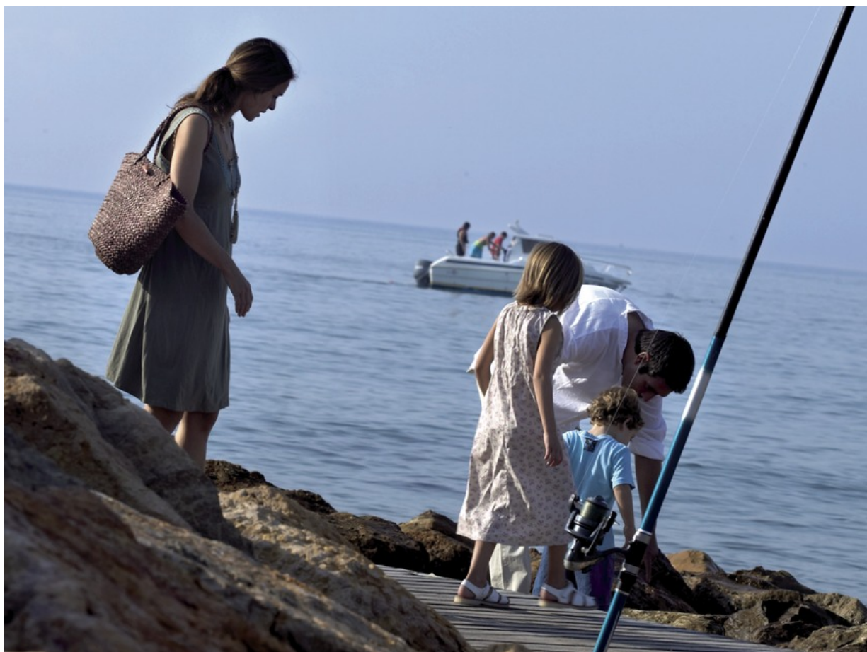
Der Küstenweg von Salou

Salou ist ein zertifiziert familienfreundliches Urlaubsziel und hat sein Angebot insbesondere auf die Wünsche und Bedürfnisse seiner kleinen Gäste ausgelegt. Das merkt man nicht erst in den familienfreundlichen Unterkünften und Restaurants, sondern schon bei einem Spaziergang über die Strandpromenade mit ihren vielen Kinderspielflächen. Ein Highlight für die ganze Familie ist ein Spaziergang über den Küstenweg von Salou. Er verläuft auf Holzstegen, so dass man beim Laufen praktisch über dem Meer schwebt. Der Küstenweg führt zu den wunderschönen Stränden und Buchten von Salou. Wer den Spaziergang im Abendsonnenlicht macht, begreift schnell woher die „Goldene Küste“ – Costa Daurada ihren Namen hat.