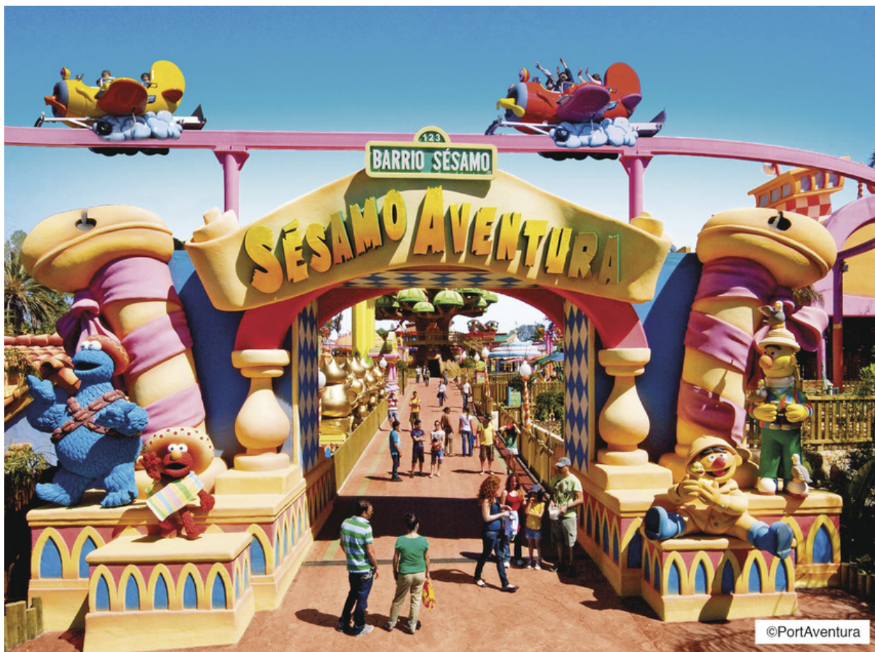
SesamoAventura an der CostaDaurada

Port Aventura ist der wohl berühmteste Themenpark der Costa Daurada. Er wimmelt nur so von Attraktionen, großen Emotionen und Spaß für Groß und Klein in unterschiedlichen Themenwelten. Doch auch für Momente der Entspannung ist hier gesorgt. Im Port de la Drassana im Themenbereich Mittelmeer, kann man auf ein Schiff steigen und eine Rundfahrt durch den Freizeitpark genießen. – Ideal um den jüngsten Familienmitgliedern ein bißchen Zeit zum Verschnaufen zu geben oder einfach mal die Füße auszuruhen. Infos gibt es hier .