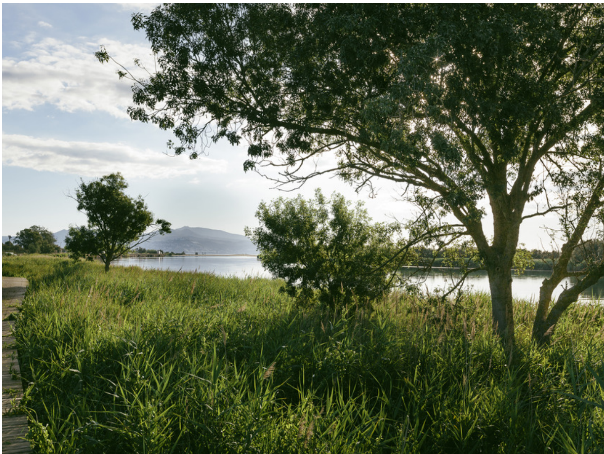
Flusslandschaft des Fluvià bei Sant Pere Pescador