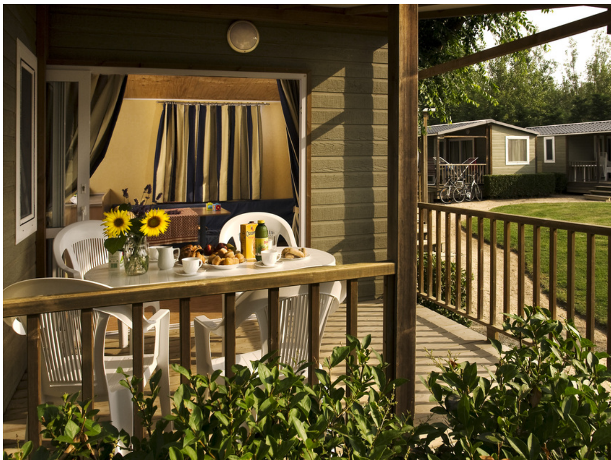
Camping in Sant Pere Pescador

Die perfekte Basecamp für einen Familienurlaub in Sant Pere Pescador ist zum Beispiel der Campingplatz La Ballena Alegre. Komfortabel ausgestattete Bungalows und eine eigene Rasenparzelle mit Hängematten sowie ein Pool in unmittelbarer Nähe garantieren einen entspannten Aufenthalt. Kinder sind vor allem von den bunten Wasserrutschen im Splash Park begeistert. Der Mini-Club für Kinder ab vier Jahren bietet außerdem reichlich Gelegenheit, Freundschaften zu schließen und kreativ zu werden. Erwachsene finden hingegen im Campingplatz eigenen Spa ganz besonderen Urlaubsgenuss. Weitere Infos gibt es hier .