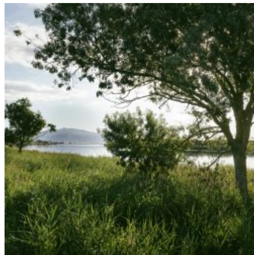
© Ajuntament de Sant Pere Pescador