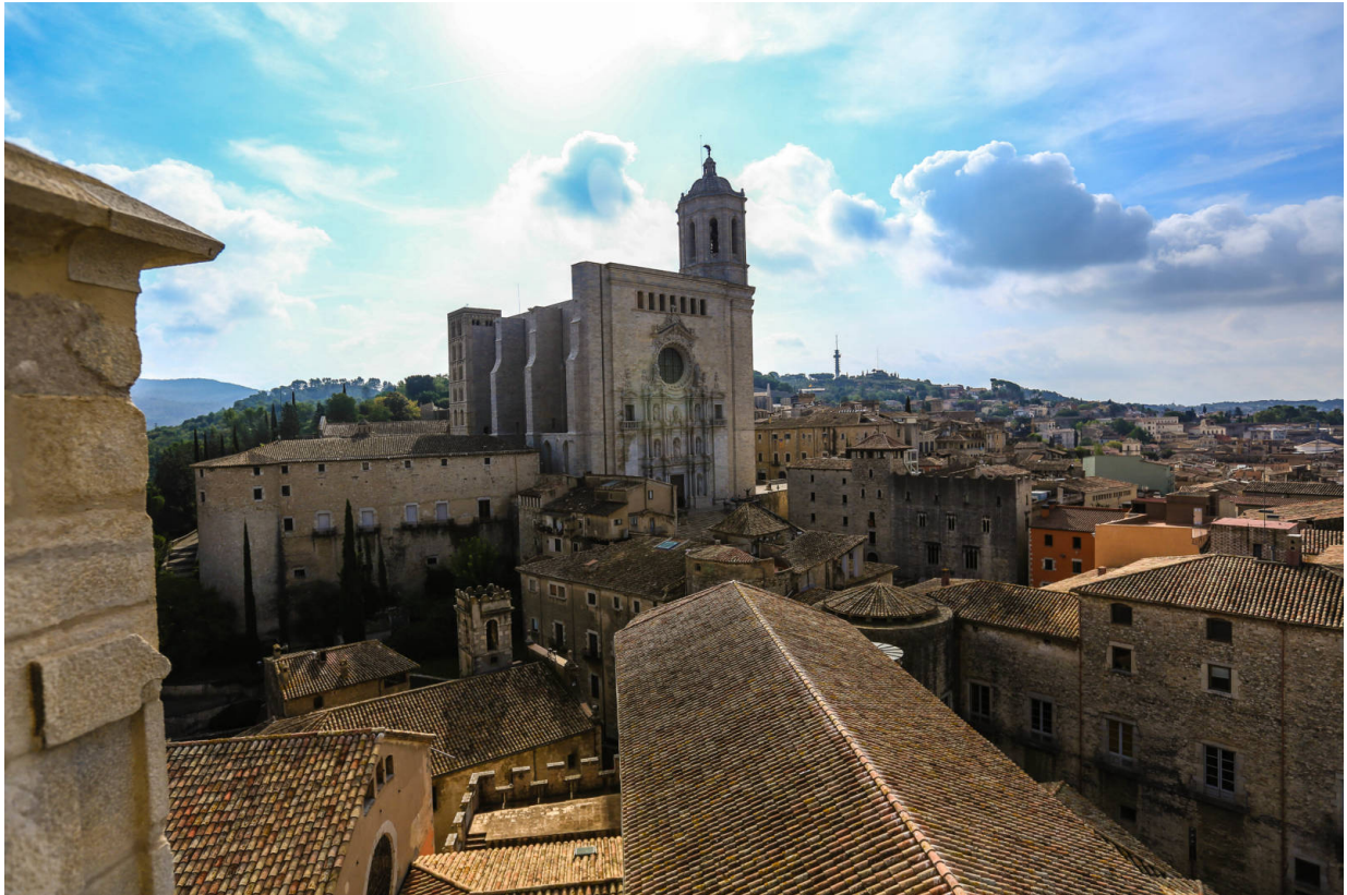
Die Kathedrale von Girona

die wichtigsten Filme wirft, die hier seit 1912 gedreht wurden.