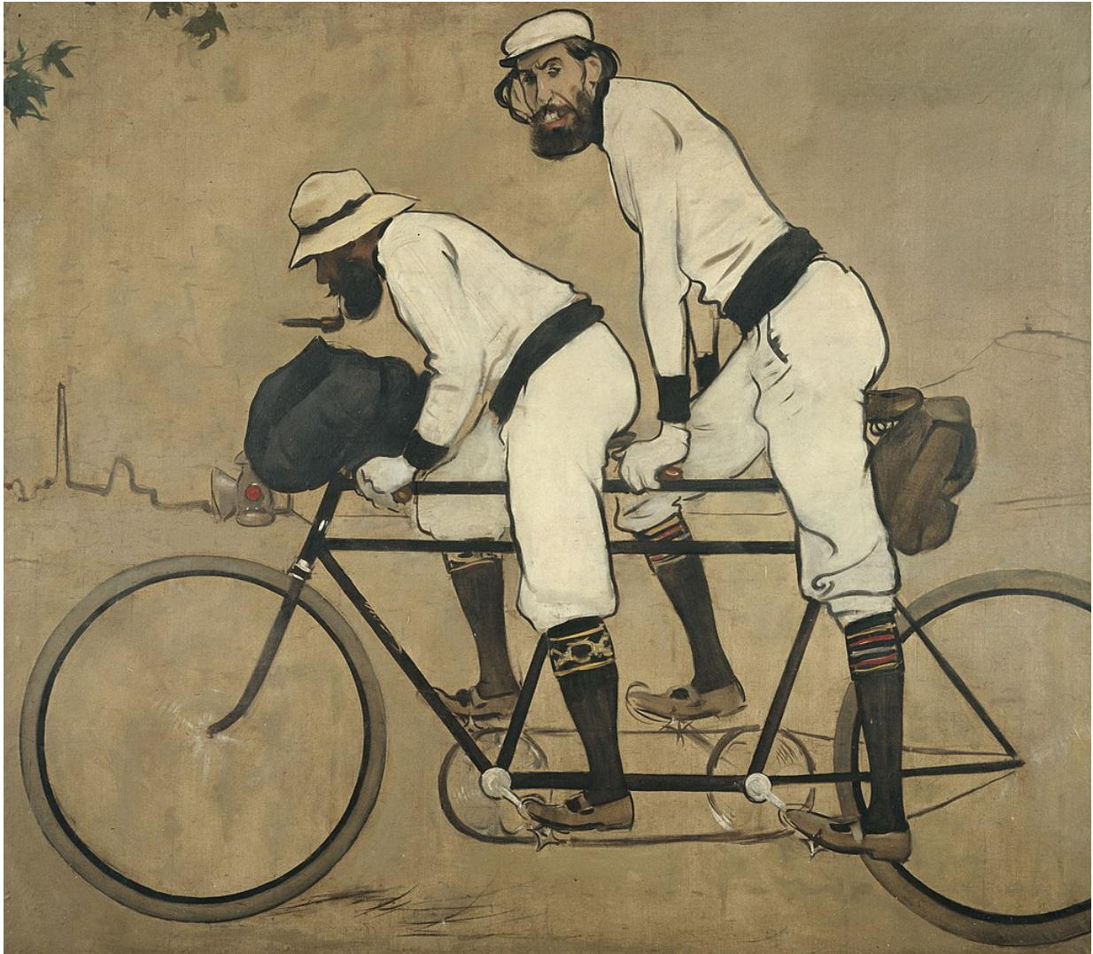
Ramon Casas: Ramon Casas und Pere Romeu auf einem Tandem (1897)