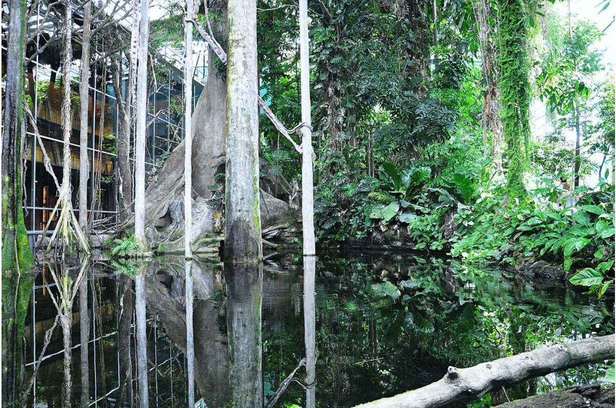
Cosmocaixa, Der überflutete Wald. Foto: Wikimedia Commons, Alberto-g-rov, Lizenz CC BY 3.0

Der „Überflutete Wald“, eine Nachbildung des Regenwaldes im Amazonas in einem 1000m 2 hohen Glashauss, ist eines der beeindruckendsten Beispiele. Hier leben 52 Tier- und 80 verschiedene Pflanzenarten. Die Besucher können hier u.a. Frösche, Schildkröten, Wasserschweine, Kaimane, Spinnen und Anacondas beobachten. Sie spüren die Hitze des Amazonas, nehmen die Gerüche des Ökosystems wahr und fühlen sogar den Regen – denn im Überfluteten Wald regnet es.