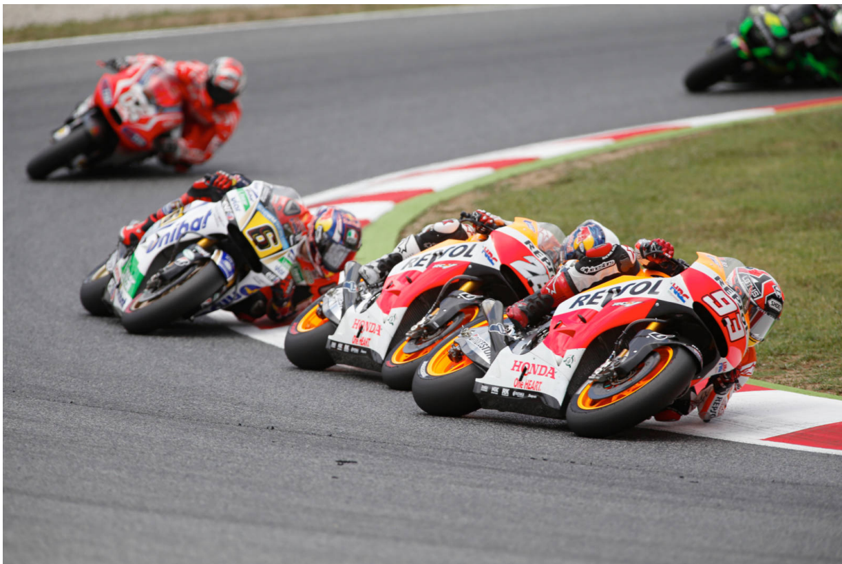
MotoGP 2