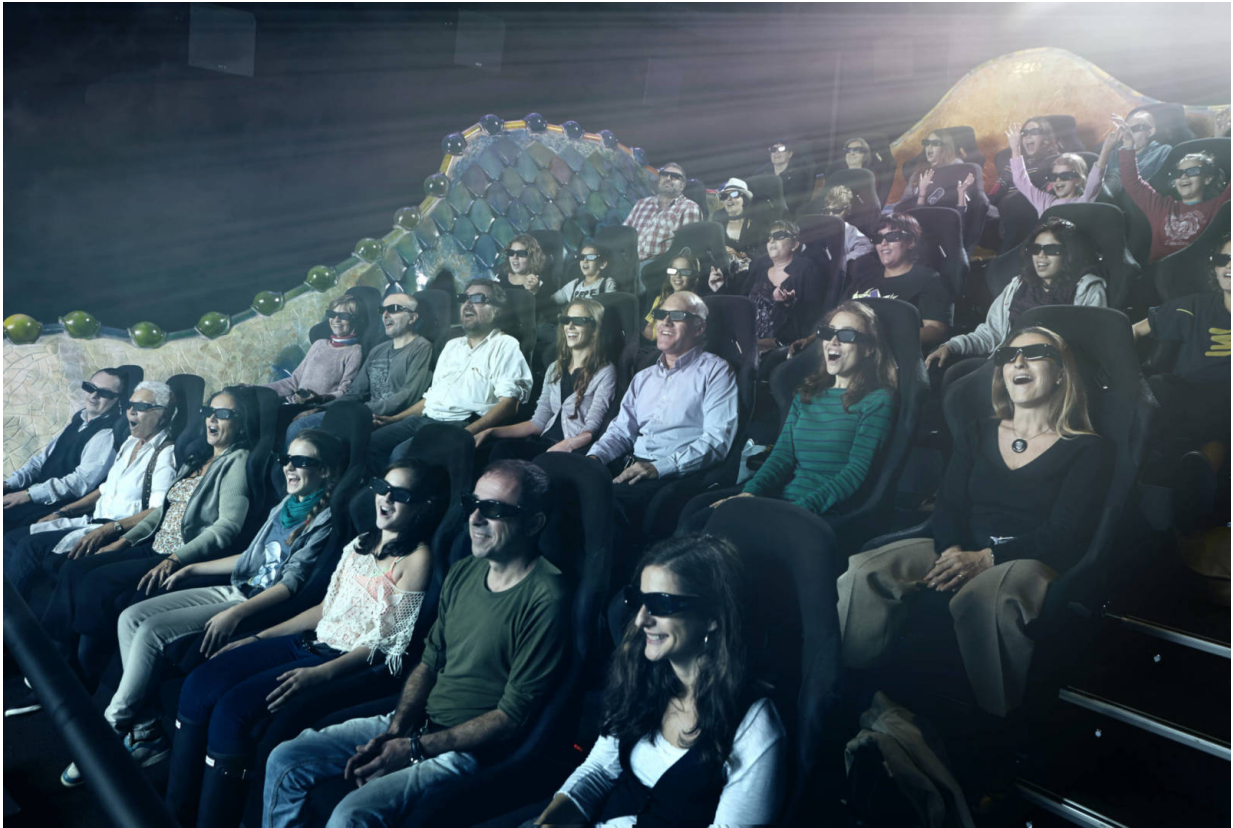
Virtuelle Realität in Action.