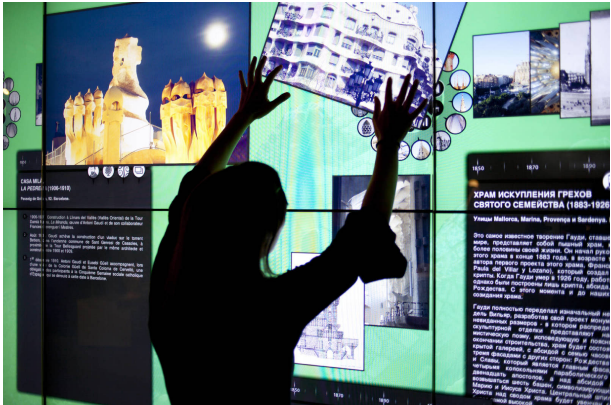
An interaktiven Bildschirmen erkunden die Besucher die Welt Gaudís.