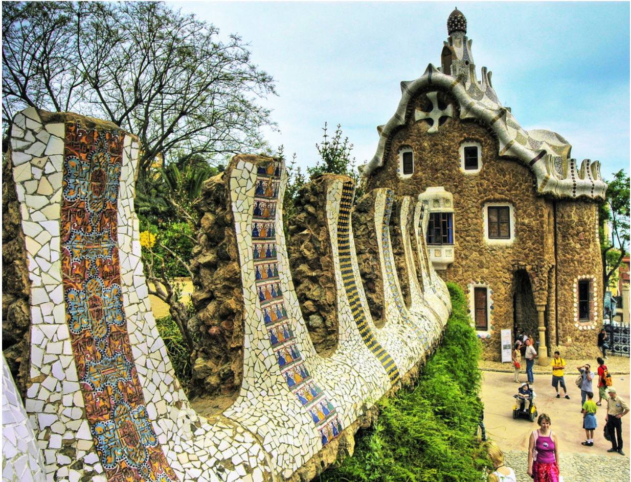
Park Güell. Foto: Wolfgang Staudt auf Flickr. Lizenz: CC BY 2.0