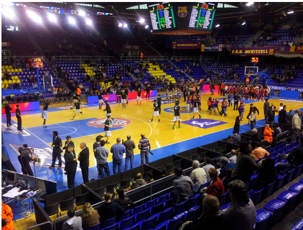
Palau Blaugrana