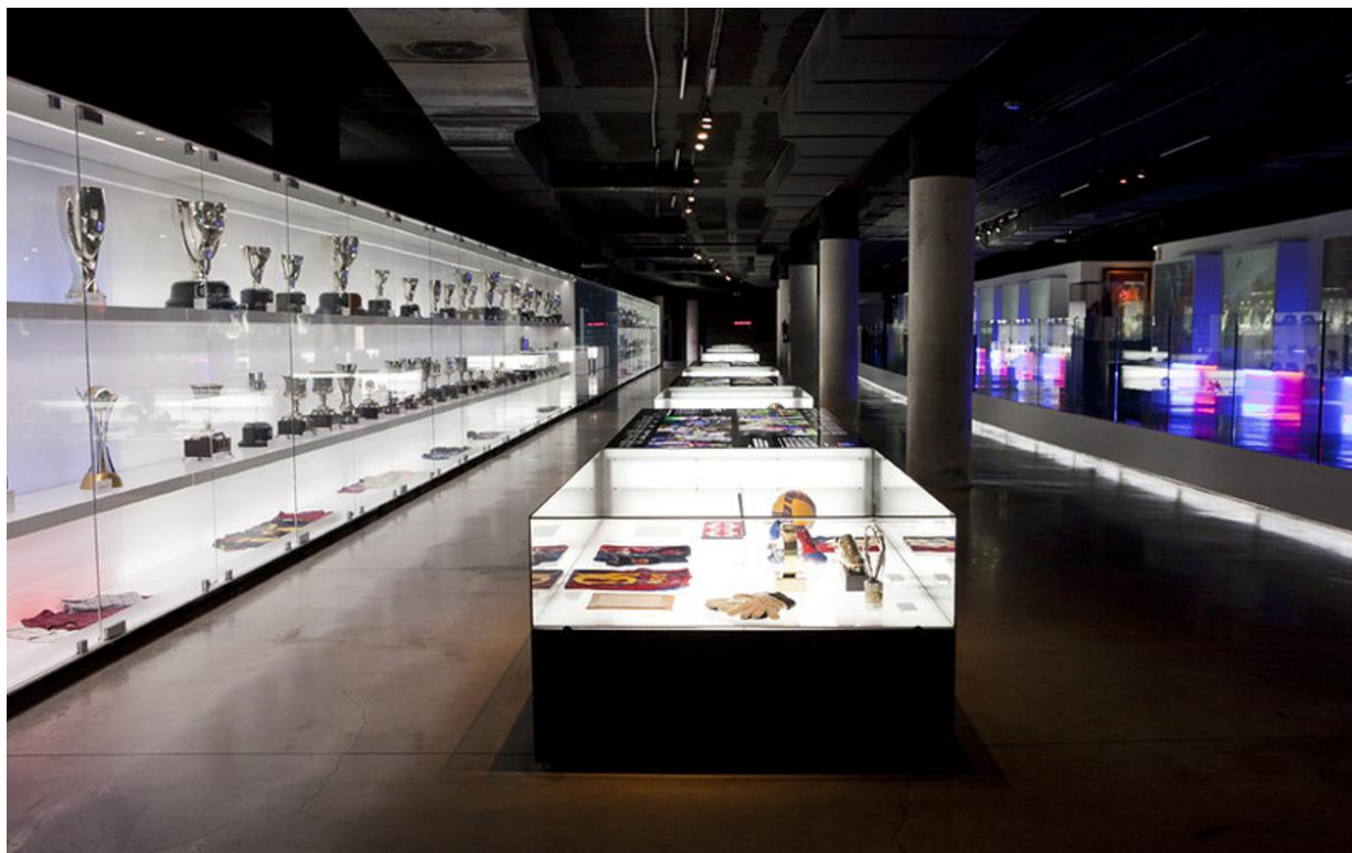
Barça.Museum © FC Barcelona

Presserräume, mehrere Fernsehstudios, das Sportmedizinische Zentrum, die Operative Kontrollstelle (UCO), das Klubmuseum des FC Barcelona und die Büros der vielen verschiedenen Abteilungen des Klubs.