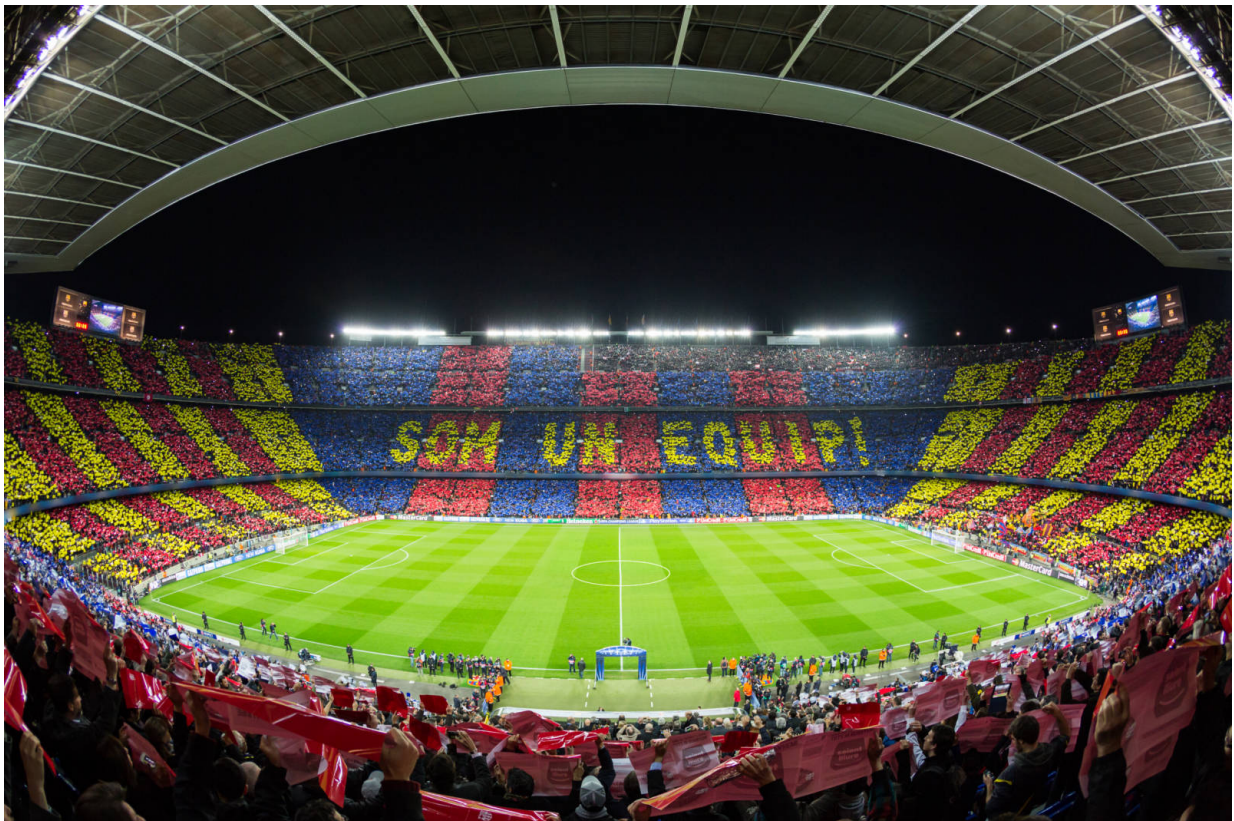
Barça - „som un equip!“

„Mehr als ein Verein“ lautet das Motto des FC Barcelona. Der auch kurz und liebevoll „Barça“ genannte Futbol Club Barcelona ist DAS sportliche Symbol katalanischer Identität. Der legendäre Club hat einige Fußball- Wunder vollbracht. So war der Barça der erste Fußballclub, der es schaffte, sechs Titel in einer einzigen Saison zu holen. 2009 gewann der Barça die spanische Meisterschaft, die Copa del Rey, die UEFA Champions League, den UEFA Super Cup, die Supercopa de España und die FIFA Klub-Weltmeisterschaft. Der Verein definiert sich jedoch nicht nur über fantastischen Fußball, sondern auch über sein soziales Engagement. Dies in Verbindung mit den charakterstarken Spielern des Teams hat dem Barça Fans in ganz Europa eingebracht.