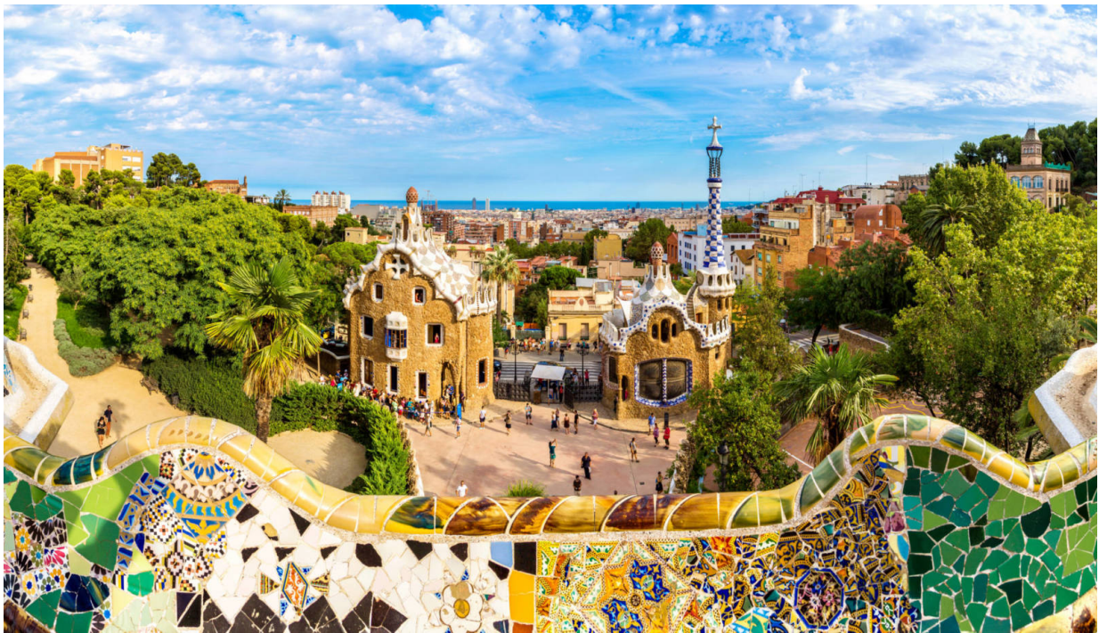
Gaudís Architektur prägt das Stadtbild Barcelonas. Hier: Park Güell

Im Laufe der kommenden Jahrzehnte sollte seine Arbeit das Stadtbild Barcelonas in unnachahmlicher Weise prägen. Sein ebenso revolutionärer wie tief in der europäischen Geschichte und der Landschaft des Mittelmeerraumes verwurzelter Baustil würde zum Inbegriff der Architektur des katalanischen Jugendstils, des Modernisme, werden.