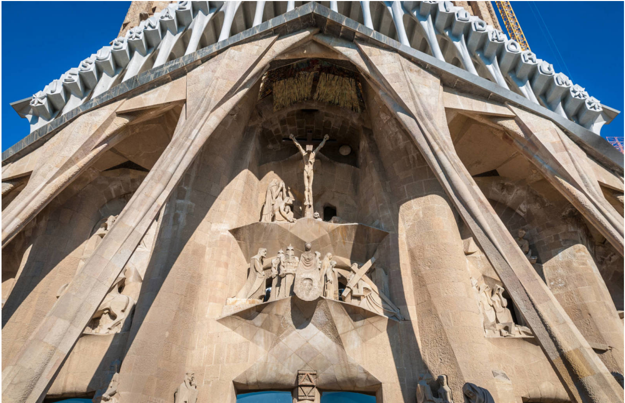
Die Kreuzigungsszene im Zentrum der Passionsfassade.