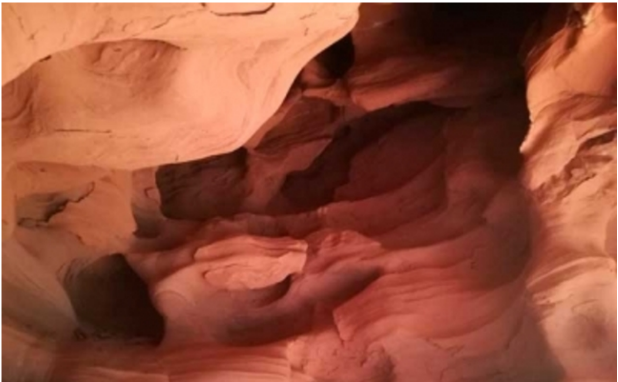
Coves Can Riera

Zwar liegen die Covas de Can Riera nur 20 Minuten von Barcelona entfernt, doch ist für die Anfahrt ein Auto nötig. Ausgangspunkt ist das Centre d'Esports Municipal de Can Roig. Von hier aus folgt man der Markierung Richtung Collet de Can Riera. Es gibt einige Hindernisse zu überwinden, wie umgestürzte Bäume und beträchtlich Höhenunterschiede, bis man schließlich auf eine Metallleiter trifft. Diese führt zur zweiten und dritten Höhe von Can Riera, die wahrhaft beeindruckend sind.