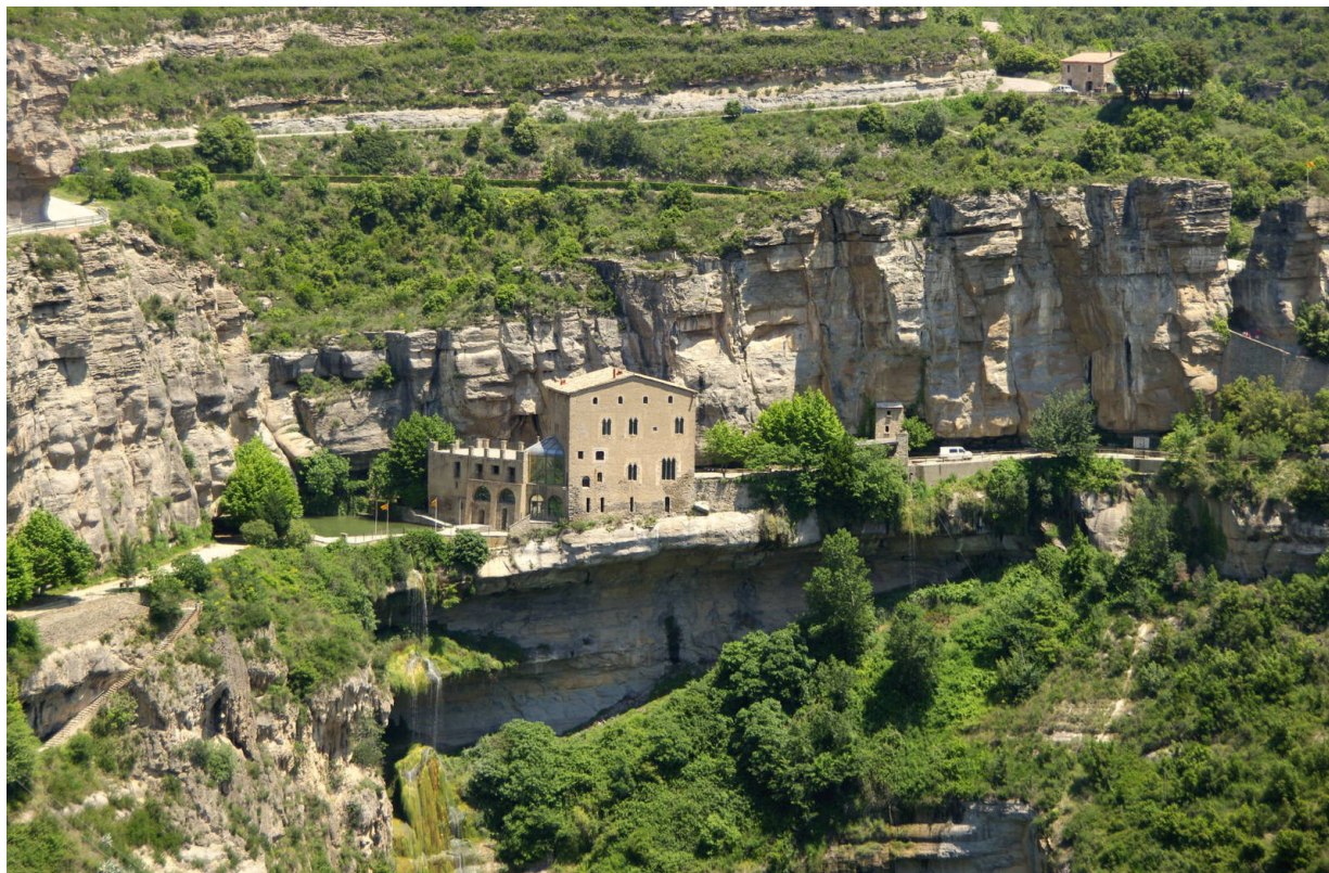
Sant Miquel de Fai.

Die Route beginnt in Riells de Fai, wo man das Auto auf einem kostenfreien Parkplatz abstellen kann. Von dort aus gelangt man in etwa zehn Minuten zur Riera de Tenes, einem der beeindruckendsten Wasserfälle des Gebietes. Dies ist der eigentliche Startpunkt der Tour, auf der man in etwa einer Stunde das Heiligtum erreicht. Zu den Höhepunkten dieses Ausflugs zählt der Besuch der romanischen Kapelle Sant Miquel, die als einzige Kataloniens in eine Höhle hineingebaut ist.