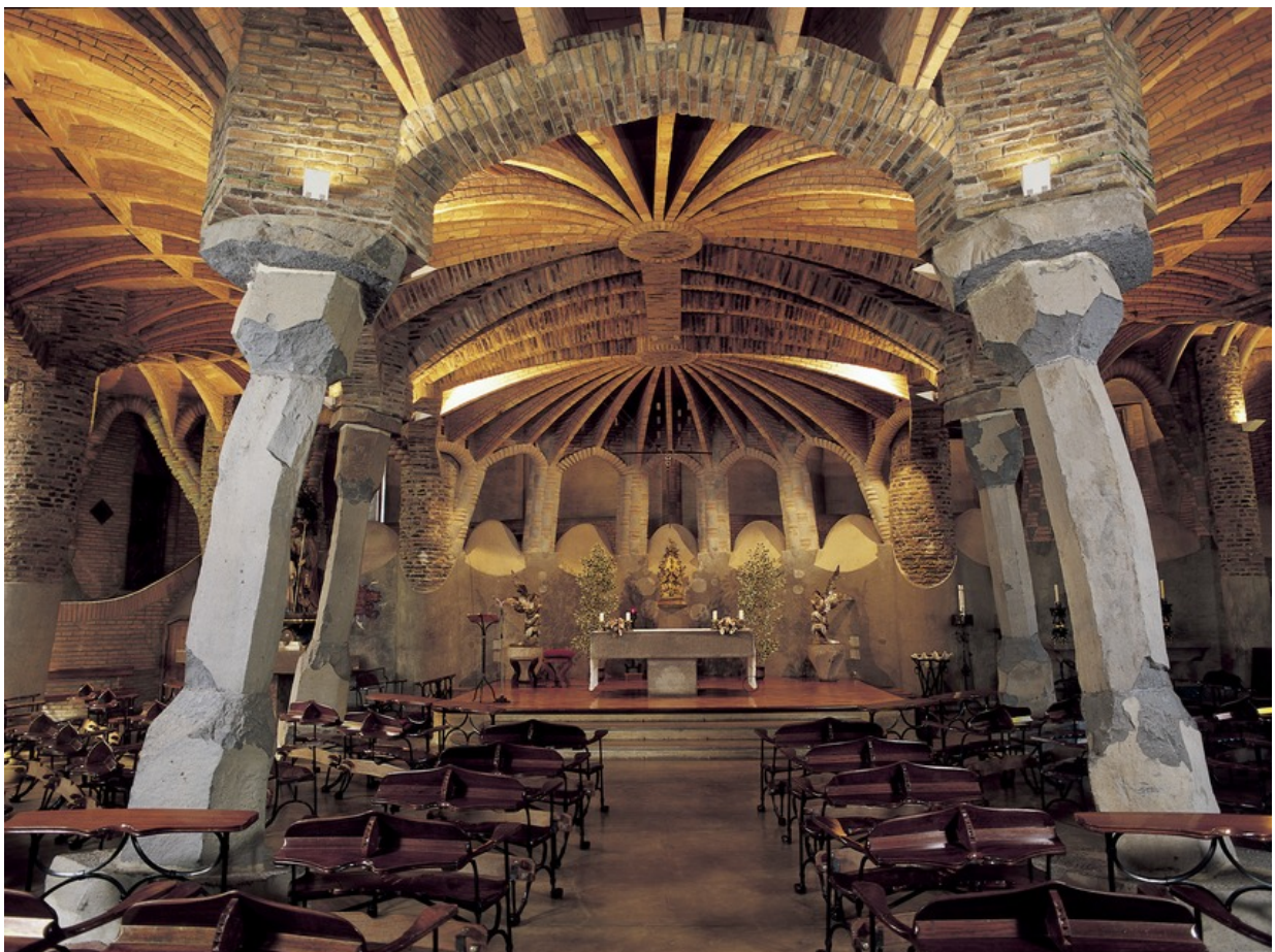
Krypta der Colònia Güell

“Barcelona ist viel mehr”. Mit diesem Slogan macht die Provinz Barcelona auf die facettenreichen Erlebnismöglichkeiten rund um die katalanische Metropole aufmerksam. Jenseits des touristischen Mainstreams kann man hier in aller Ruhe wahre Perlen authentisch katalanischer Kultur und Natur entdecken. Falls Sie also eine kurzfristige Auszeit vom Buzz von Barcelona City suchen und Lust auf eine kleine Wanderung haben, ist dieser Beitrag für Sie. Wir stellen Ihnen fünf familientaugliche Wanderungen in der Provinz Barcelona vor. Freuen Sie sich auf überraschende, zauberhafte und tiefenentspannte Kultur- und Naturerlebnisse rund um Barcelona.