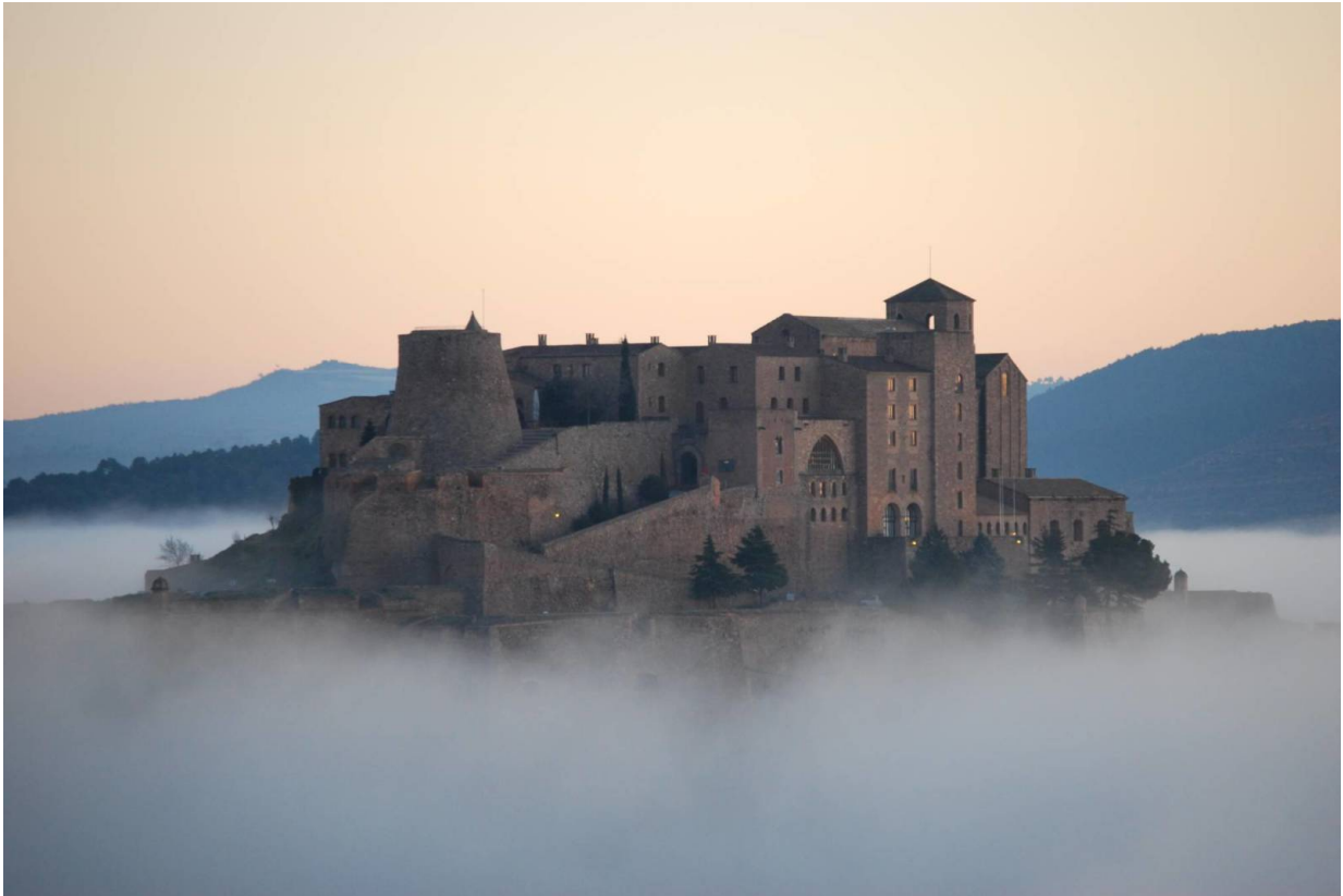
Die Burg von Cardona