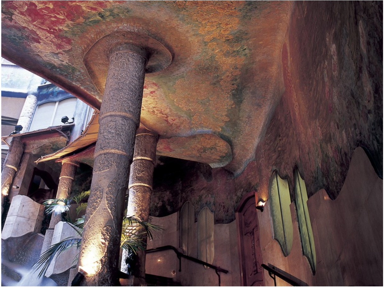
La Pedrera – Ein Meisterwerk der Natur

Tintenfisch- Stern und Schneckenmuster bis zu den ergonomisch geformten Türdrückern aus Bronze. Wer mehr wissen möchte, liest hier weiter. Spannende und unterhaltsame Einblicke in die Vorstellungswelt Antoni Gaudís bietet überdies Gaudí Experiència , eine interaktive Ausstellung mit 4D-Kino.