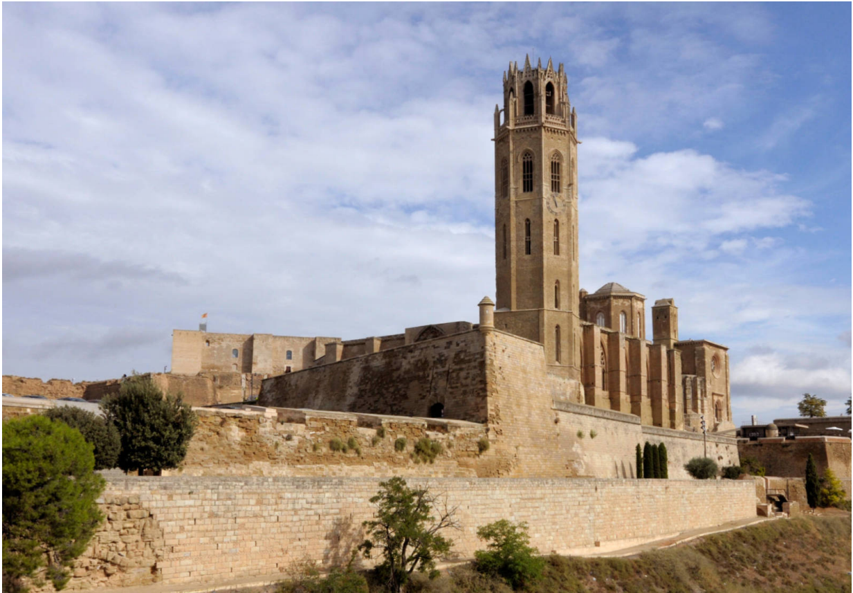
Die Seu Vella, Lleidass alte Kathedrale, ist das Wahrzeichen der Stadt