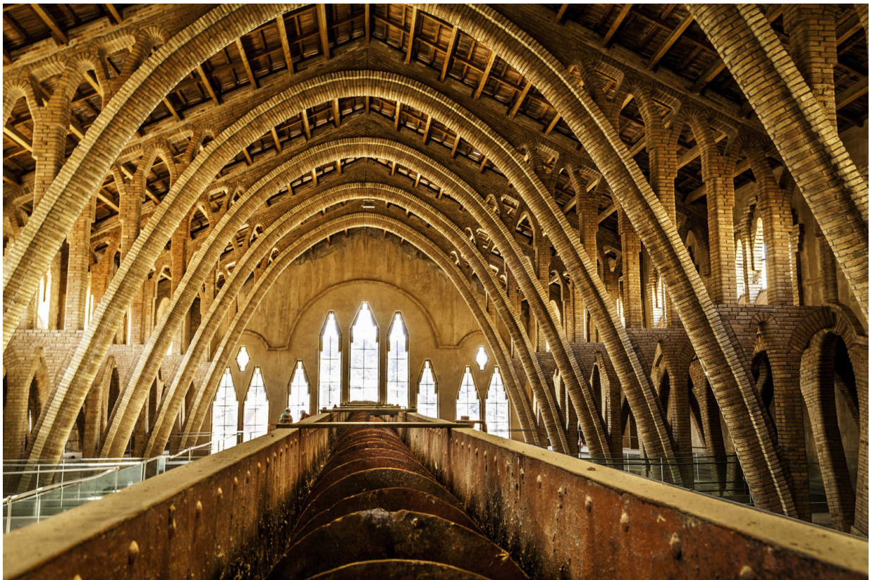
Die Wein-Kathedrale von El Pinell de Brai

Besuch abstaten, der sich ganz wunderbar mit einer Weinverkostung kombinieren lässt. Weitere Infos gibt es hier .