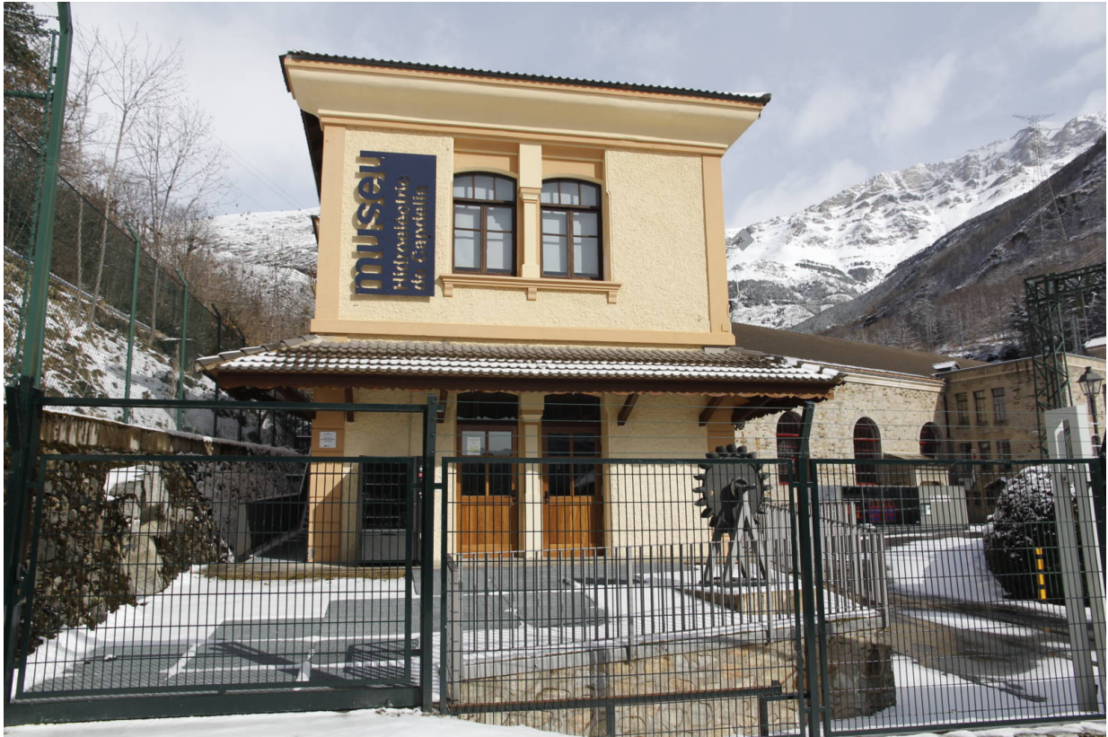
Das Hydroelektrische Museum im Vall de Fosca