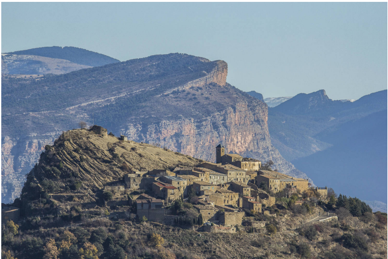
Santa Engracia

In den katalanischen Pyrenäen liegt der Unesco-Geopark Orígens. Auf einem Gebiet von 2.040km 2 erwarten den Besucher hier ebenso facettenreiche wie atemberaubende Erlebnisse. Hier kann man auf den Spuren von Dinosauriern wandern oder entlang schwindelerregender Hohlwege tiefe Schluchten durchqueren. Höhlenmalereien und historische Gemäuer werfen Schlaglichter auf die Entwicklungsgeschichte des Menschen in einer Region abseits der großen städtischen Zentren.