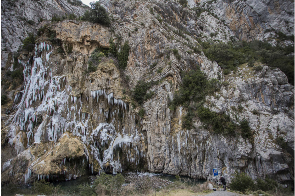
Beeindruckende Felsformationen im Geopark Orígens