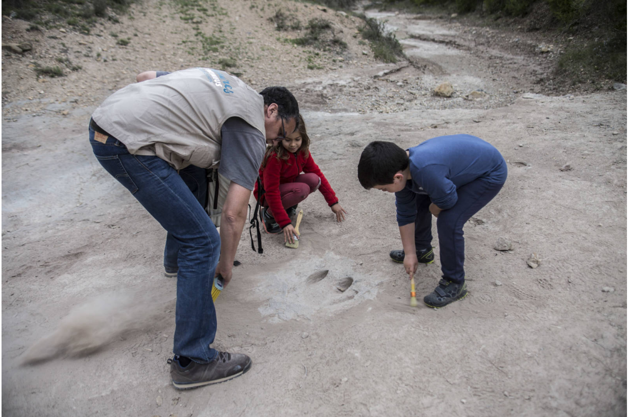
Auf den Spuren der Dinosaurier © Jordi Peró