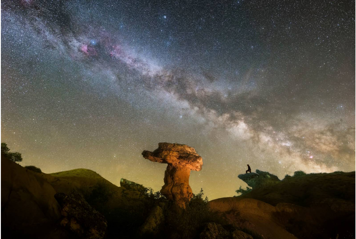
Roca Bolet im Starlight Reserve Montsec