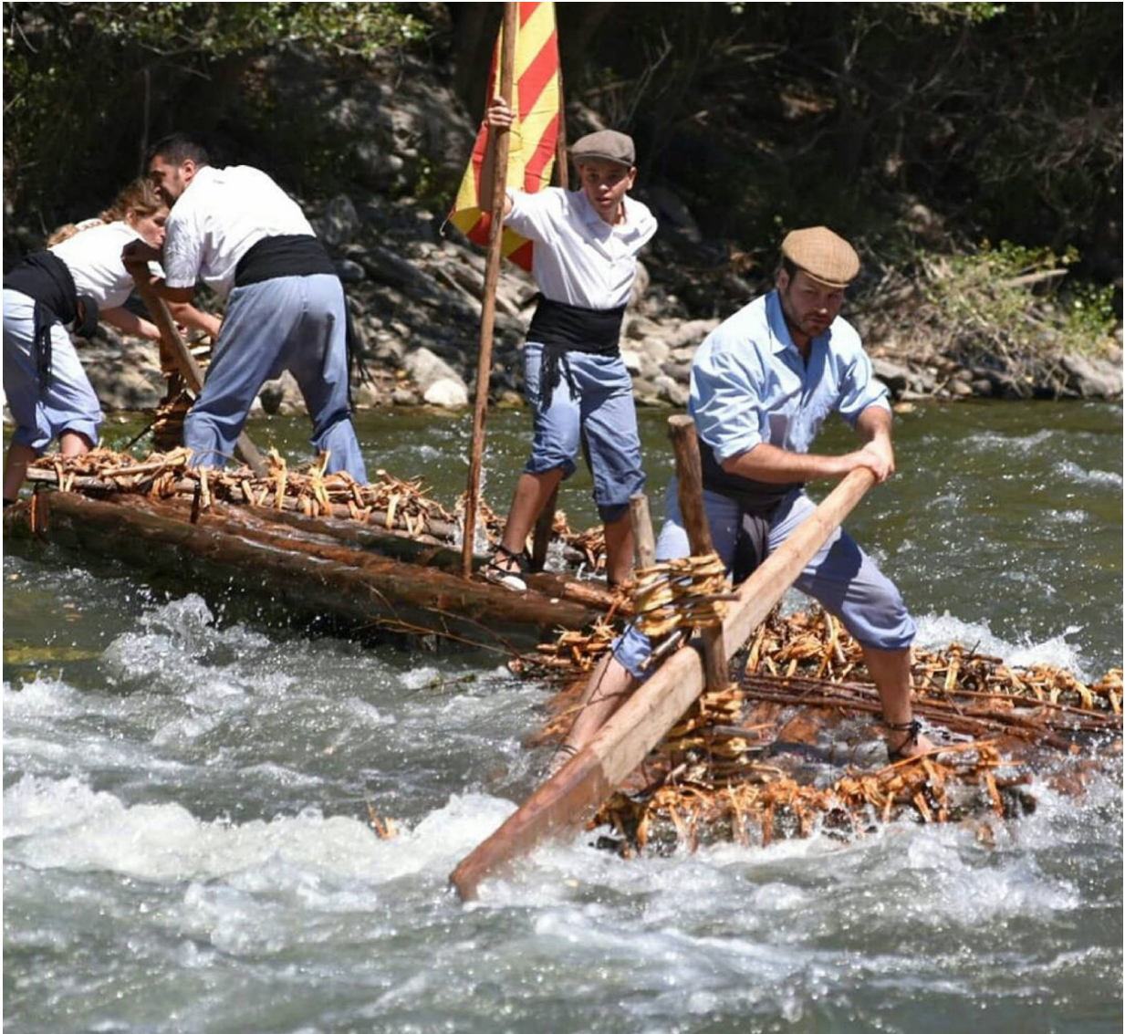
Die Raiers von Coll de Nargo