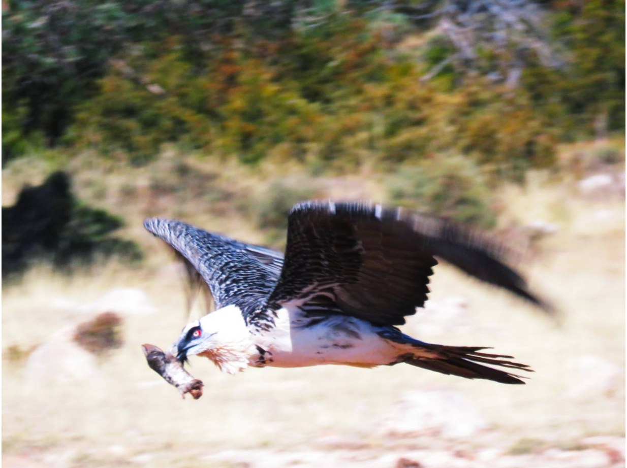
Bartgeier im Geopark Orígens